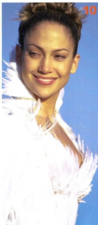
Spätestens seit «Out of Sight» zählt Jennifer Lopez zu den Stars in Hollywood. In «The Cell» stellt die charismatische Lateinamerikanerin ihre Wandelbarkeit unter Beweis. Und schon bald soll sie als Frida Kahlo vor der Kamera stehen.