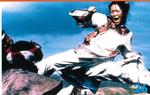
Schwerter zu «Flugrollen»: Ang Lees romantisches Kampfballet «Crouching Tiger, Hidden Dragon» bewegt sich auf den Spuren traditioneller chinesischer Kultur.