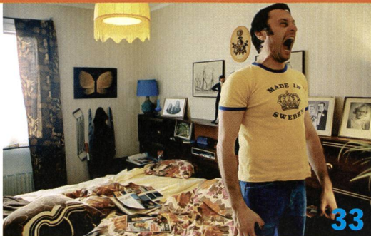
Leben in der Kommune: In «Together» blickt Lukas Moodysson zurück in eine Zeit sympathischer Träume. Und hält, was er mit seinem Erstling «Fucking Åmål» versprochen hat.