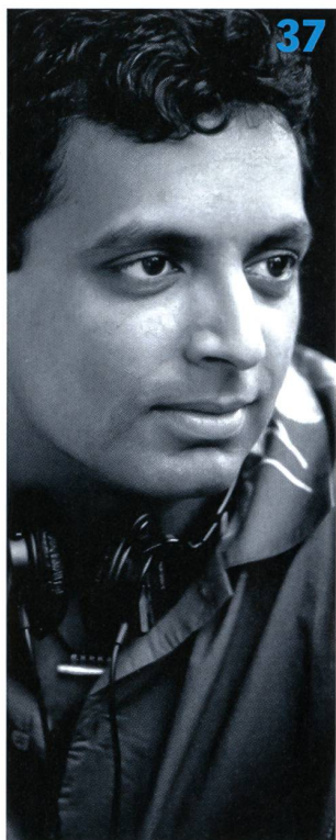
Mit seinem neuen Film «Unbreakable», den er wiederum mit Bruce Willis in der Hauptrolle realisiert hat, schliesst M. Night Shyamalan an seinen Überraschungserfolg «The Sixth Sense» an. Ein Gespräch mit dem Regisseur und Drehbuchautor, dem in Hollywood im Moment alle Türen offen stehen.