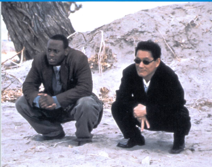
Omar Epps, Takeshi Kitano