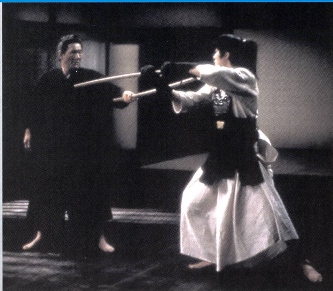
Takeshi Kitano (links), Ryuhei Matsuda