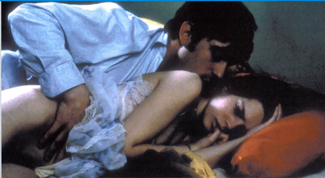
Libero de Rienzo, Roxane Mesquida