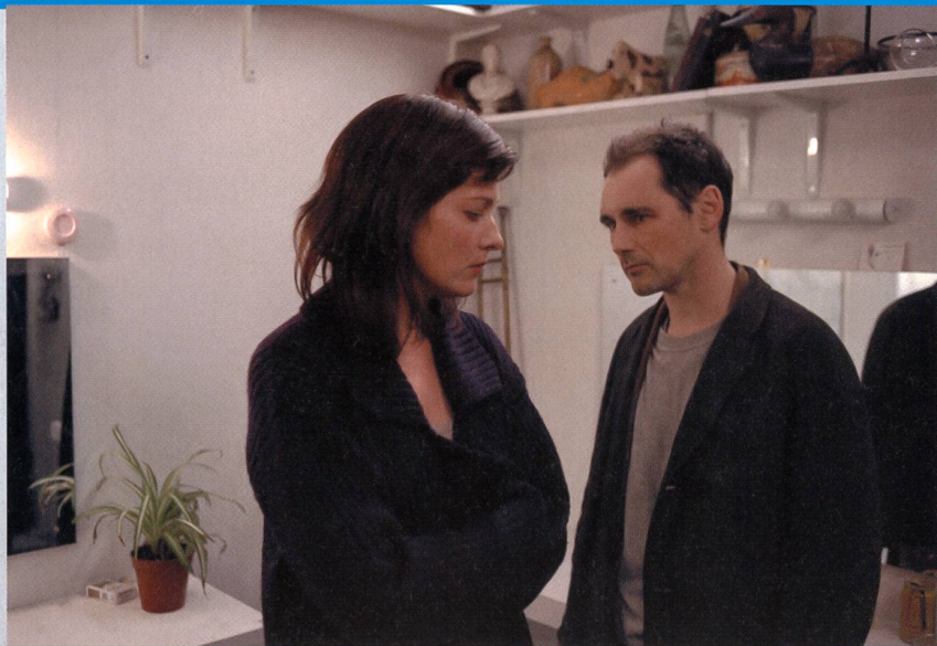
Kerry Fox, Mark Rylance