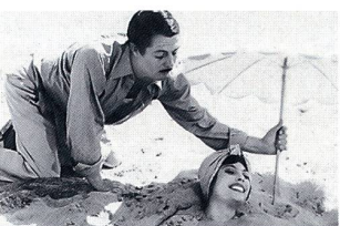
«Divorce à l'italienne» lundi 19 juin