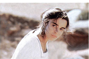
«Les raisons du cœur» vendredi 23 juin