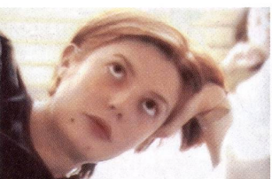
«Comment je me suis disputé...» ve 16 juin