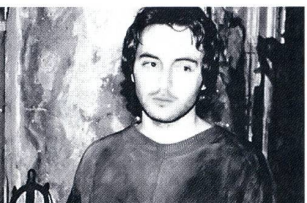
«The House» vendredi 9 juin