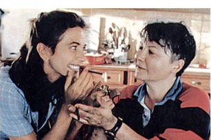
«Gazon maudit» mardi 27 juin

la maison, dans une Italie à feu et à sang. «La grande pagaille» met en lumière une période méconnue et cruciale de l'histoire italienne, entre drame et comédie. (fm)