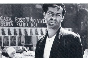
«La grande pagaille» vendredi 23 juin