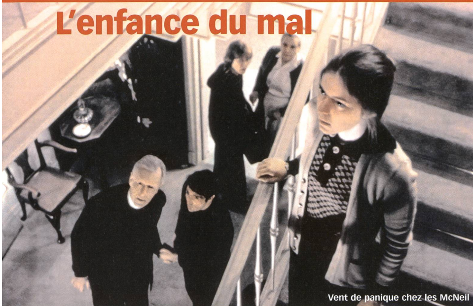
Vent de panique chez les McNeil