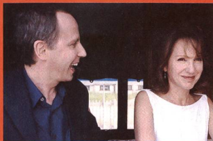
«Barnie et ses petites contrariétés»