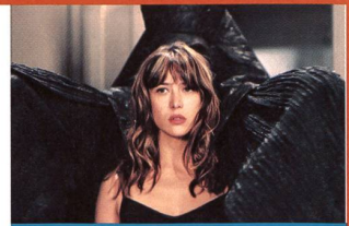
«Belphégor, le fantôme du Louvre»