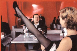
«L'art (délicat) de la séduction»