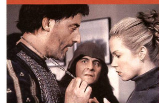
«Les visiteurs en Amérique»