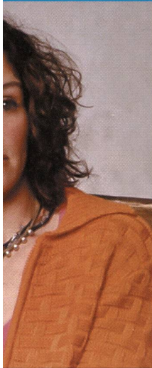
Jerry (Brad Pitt) et Samantha (Julia Roberts)