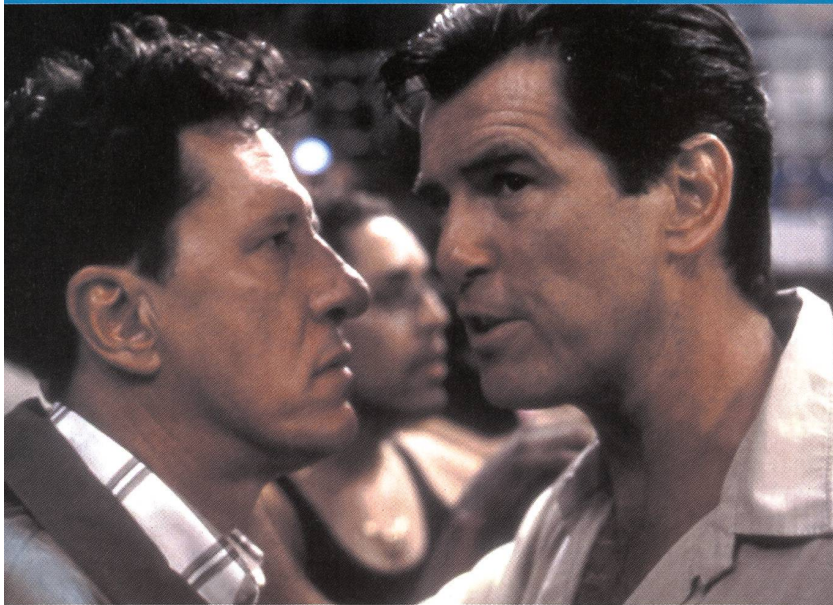
L'art de la persuasion selon Osnard (Pierce Brosnan)