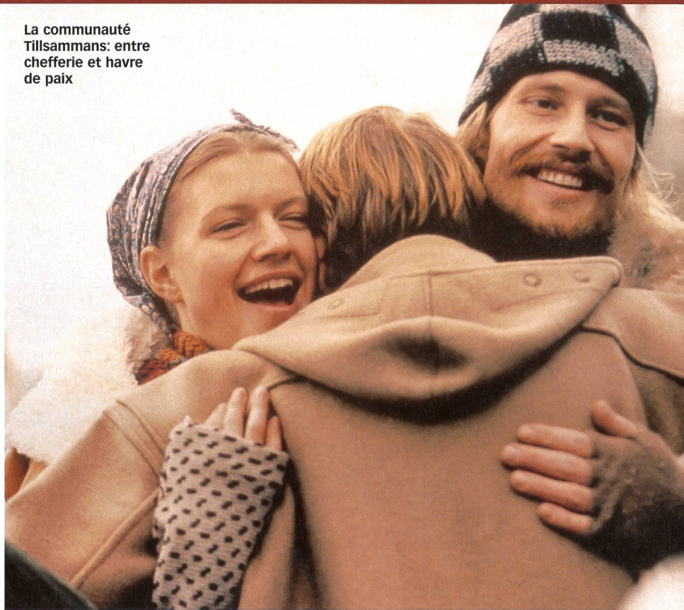
La communauté Tillsammans: entre chefferie et havre de paix