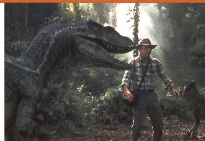
«Jurassic Park 3»

autres celui des geôliers. Rapidement, les matons abusent de leur pouvoir et la situation dégénère... Oliver Hirschbiegel s'est inspiré d'une recherche, minutieusement restituée, réalisée à l'Université de Stanford en 1971: après sept jours, on arrêta tout, tant les vingt hommes étaient devenus incontrôlables... (al) «Das Experiment». Avec Moritz Bleibtreu, Christian Berkel, Oliver Stokowski... (2001, Allemagne - Elite). Durée 2 h 00. En salles le 15 août.