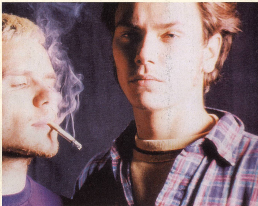
«My Own Private Idaho», road movie de Gus Van Sant