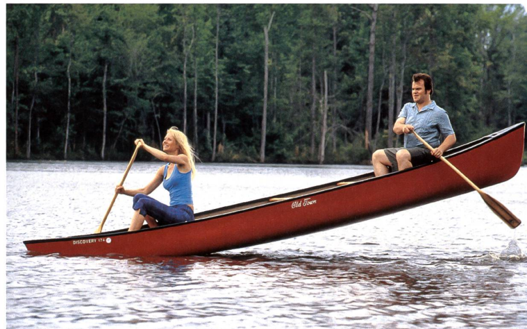
▼ Balade romantique pour Hal (Jack Black) et Rosemary (Gwyneth Paltrow)