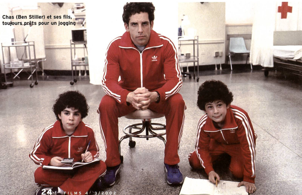
Chas (Ben Stiller) et ses fils, toujours prêts pour un jogging