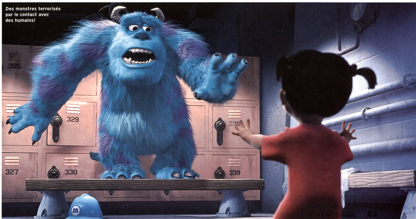
Des monstres terrorisés par le contact avec des humains!