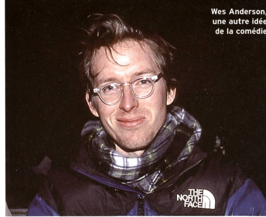
Wes Anderson, une autre idée de la comédie