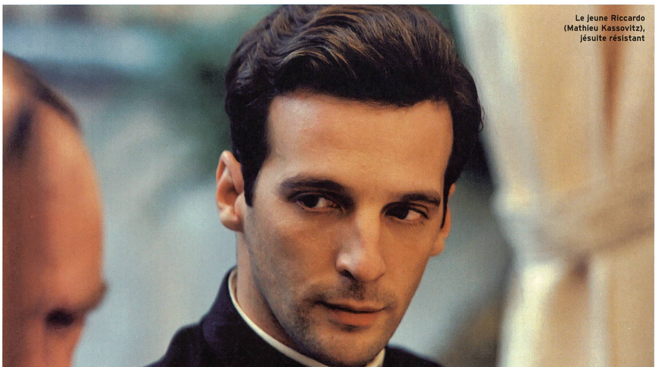
Le jeune Riccardo (Mathieu Kassovitz), jésuite résistant