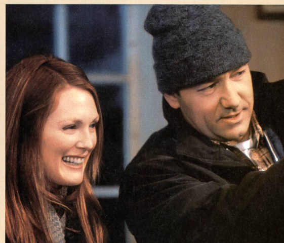
Quoyle (Kevin Spacey) et Wavy (Julianne Moore), deux cœurs en sommeil