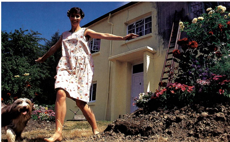
▲ Annie Marie (Rachel Griffiths), trentenaire en quête d'émancipation