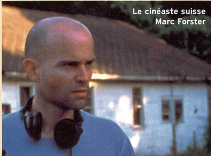
Le cinéaste suisse Marc Forster

C'est une star hollywoodienne pleine de glamour. Au départ, je ne pensais pas qu'elle serait crédible dans le rôle d'une femme du Sud à l'âme perdue. C'est l'exact contraire de Billy Bob. Elle s'isole souvent pour se concentrer. Une fois, elle s'est même cachée dans une armoire! Elle se prépare à fond et