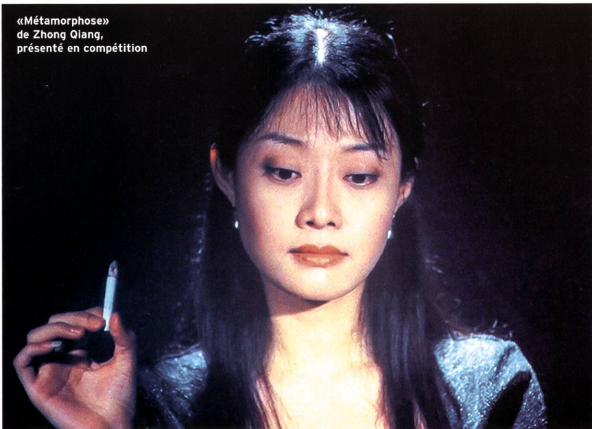
«Métamorphose» de Zhong Qiang, présenté en compétition

Dans des cinématographies du Sud toujours plus fragilisées par le manque de soutiens financiers, le court métrage constitue souvent l'ultime recours... C'est pourquoi le Festival lui a toujours ménagé une place de choix. Cette année, la section «Moyens et courts métrages» propose près de dix-sept films, avec une délégation imposante venue d'Iran... Pas moins de sept œuvres figurent au programme, toutes documentaires et réalisées avec peu de moyens par une nouvelle génération de cinéastes iraniens qui portent sur leur pays un regard très inquiet. La plus frappante d'entre elles, «Noir» («Siahi», 2001) de Nader Tarighat, décrit le quotidien d'un aveugle qui survit en réparant de vieux postes de radio avec une dextérité impressionnante. Toujours dans le domaine du court, le Festival montrera une sélection de quatre films d'étude réalisés dans le cadre de l'école de cinéma cubaine de San Antonio de los Baños, dont l'irrésistible «Les gens qui pleurent» («Gente Que Lloro S.A.», 2001) de Hatem Khraiche Ruiz-Zorrilla, une perle comique qui décrit les affres d'une pleureuse professionnelle. (vm)