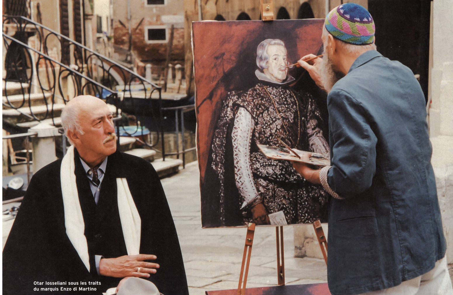
Otar Iosseliani sous les traits du marquis Enzo di Martino