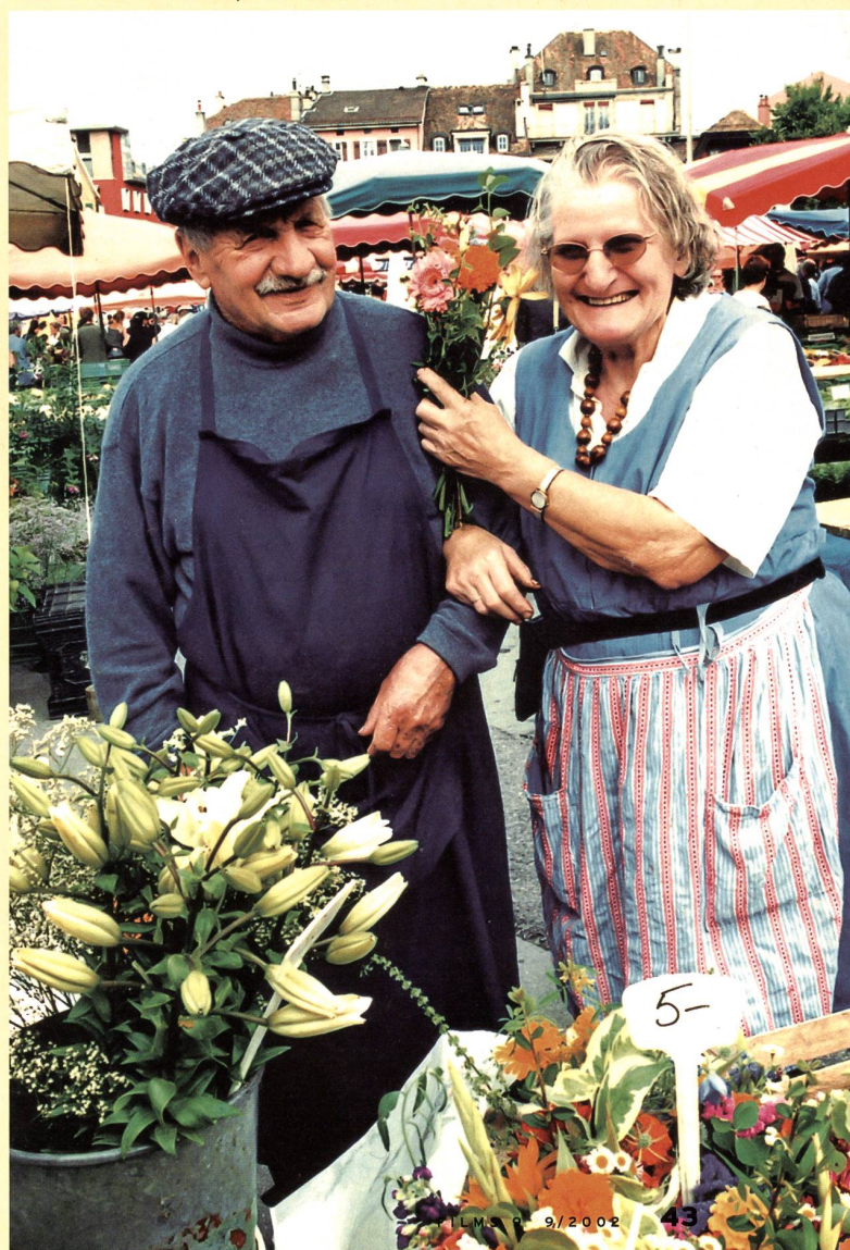
«Jour de marché» de Jacqueline Veuve

Images'02 cinéma. Vevey et Chexbres. Du 20 au 22, du 27 au 29 septembre, du 4 au 6 octobre, Renseignements: Fondation Vevey, Ville d'Images, tél. 021 922 48 54, fax 021 922 48 55, e-mail info@images.ch, site www.images.ch