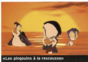
«Les pingouins à la rescousse»

Avec Patrick Timsit, José Garcia, Marianne Denicourt... (2002, France - Frenetic). Durée 1 h 40. En salles le 16 octobre.