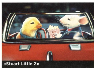
«Stuart Little 2»