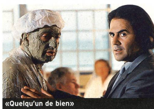
«Quelqu'un de bien»

Avec Stephen Chow, Vicki Zhao Wei, Ng Mang-Tat... (2001, Chine - Filmcooperative). Durée 1 h 28. En salles le 9 octobre.