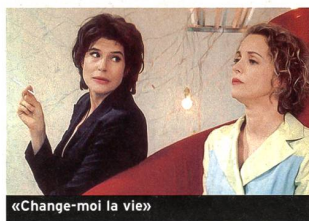
«Change-moi la vie»

Avec Zhou Xun, Chen Kun, Liu Ye... (2002, France - Filmcooperative). Durée 1 h 58. En salles le 9 octobre.