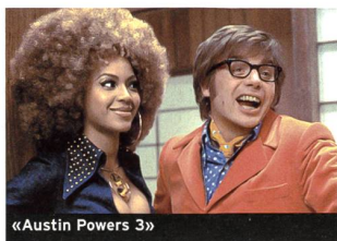
«Austin Powers 3»