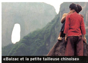
«Balzac et la petite tailleuse chinoise»

Mieux vaut limiter l'évocation d'un film aussi dépourvu d'intérêt: ce genre de pitrerie s'essaie rarement à la philosophie. Les dernières aventures d'Austin Powers font donc honneur à leur réputation en restant aussi sinistrement consternantes que les précédentes. Ceux qui s'intéressent aux comédies les plus intellectuellement désastreuses du cinéma américain pourront trouver ici matière à réflexion... (sf) «Austin Powers in Goldmember». Avec Mike Meyers, Beyoncé Knowles, Michael Caine... (2002, USA - Warner Bros.). Durée 1 h 35. En salles le 23 octobre.