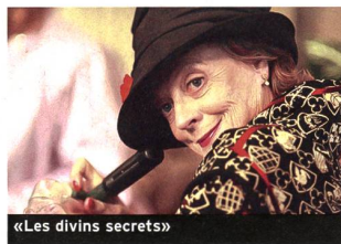
«Les divins secrets»

«Divine Secrets of the Ya-Ya Sisterhood». Avec Sandra Bullock, Ellen Burstyn, Maggie Smith... (2002, USA - Warner Bros.). Durée 1 h 56. En salles le 9 octobre.