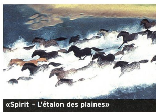
«Spirit - L'étalon des plaines»