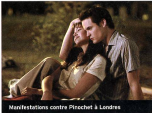
Manifestations contre Pinochet à Londres

«The Guru». Avec Jimi Mistry, Heather Graham, Marisa Tomei... (2002, USA - UIP). Durée 1 h 34. En salles le 13 novembre.