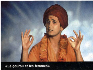
«Le gourou et les femmes»

«Changing Lanes». Avec Ben Affleck, Samuel L. Jackson, Toni Colette... (2002, USA - UIP) Durée 1 h 39. En salles le 6 novembre.