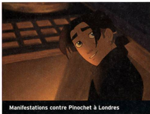
Manifestations contre Pinochet à Londres