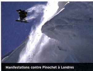
Manifestations contre Pinochet à Londres