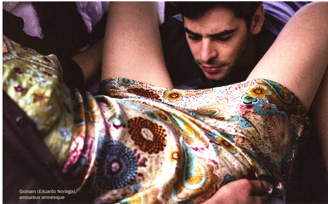
Graham (Eduardo Noriega), amoureux amnésique