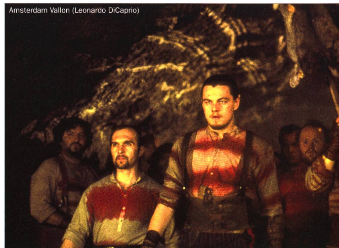
Amsterdam Vallon (Leonardo DiCaprio)

L'idée intéressante du scénario consiste à faire se télescoper deux vues politiques: celle, primitive, des clans, et celle, tout en pots-de-vin, de la démocratie naissante qui a déjà des allures de ploutocratie. Les riches échappent en effet à la guerre en payant 300 dollars, somme astronomique pour un habitant de Five Points. Tout absorbés par leurs larcins quotidiens, les