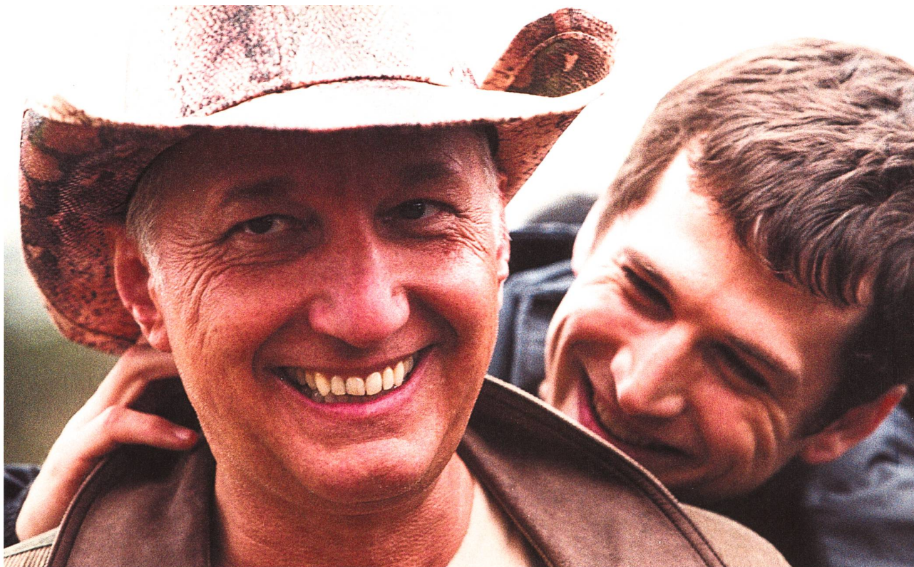
François Berléand en producteur de reality shows et Guillaume Canet