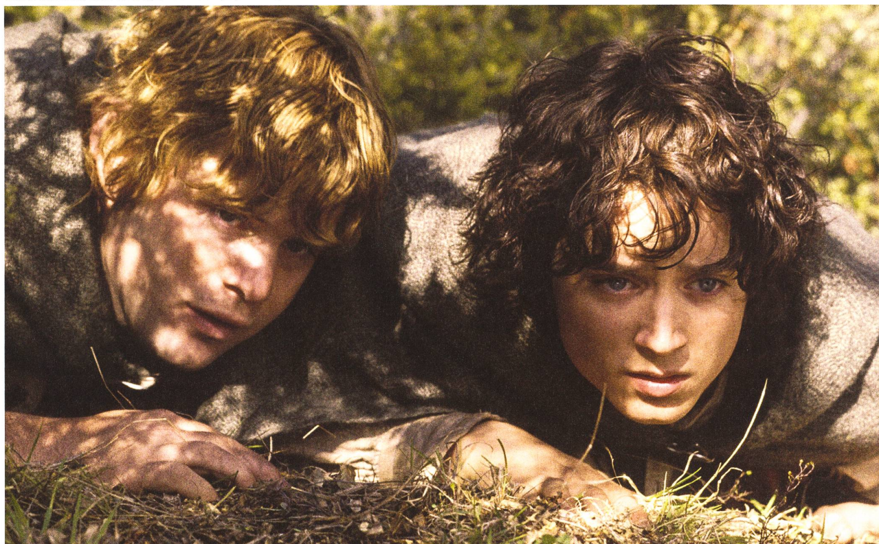
Sam (Sean Astin), fidèle compagnon de Frodon (Elijah Wood)