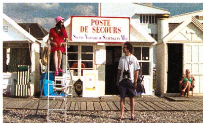
La plage de galets de Cayeux

En tissant les liens, les regrets et les amours manquées des uns et des autres sur ce bord de mer mélancolique, le film parvient à rendre subtilement la sensation du temps qui s'écoule lentement. Au lieu du changement de saison en saison, c'est bien plutôt l'érosion des choses et des gens que capte la réalisatrice, usure que métaphorise l'étrange