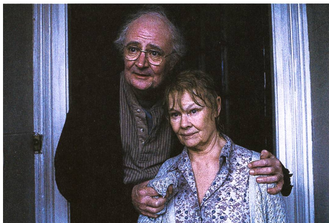
John Bayley (Jim Broadbent) et Iris (Judi Dench)

Alors qu'Iris-la-philosophe n'a cessé de méditer sur les liens entre langage et pensée, on la retrouve quittée par les mots, étrangère à elle-même et aux autres. Le seul être qui ne l'abandonne pas à son inexorable dégradation et s'obstine de façon touchante (parce que vaine) à la guérir, est celui qui fut son conjoint pendant 40 ans, John Bayley,