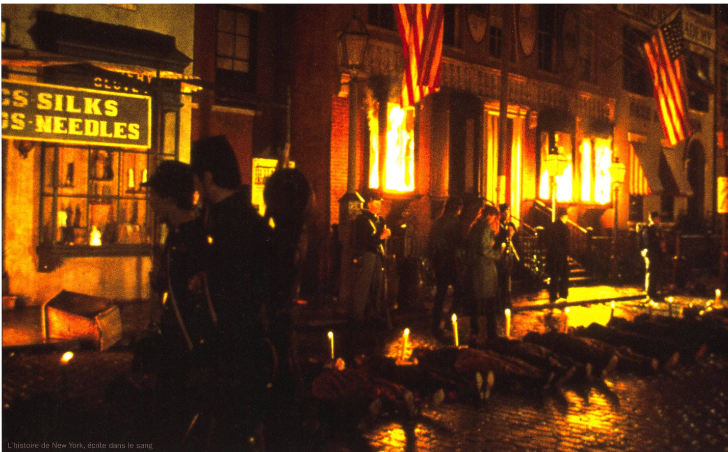
L'histoire de New York, écrite dans le sang