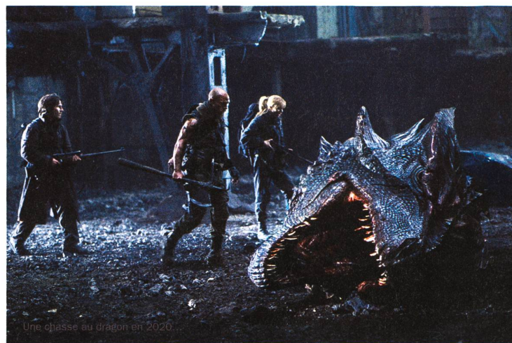
Une chasse au dragon en 2020.

Rob Bowman («Aux frontières du réel / X-Files») a pris la chose au