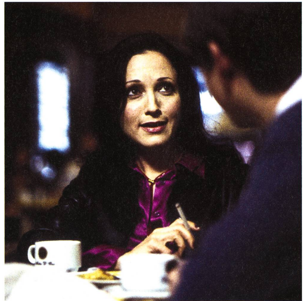
Diane (Bebe Neuwirth), amie de la famille sensible au charme d'Oscar (Aaron Stanford)