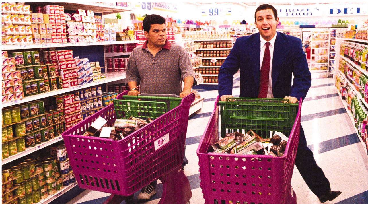
Adam Sandler dans un rôle sur mesure