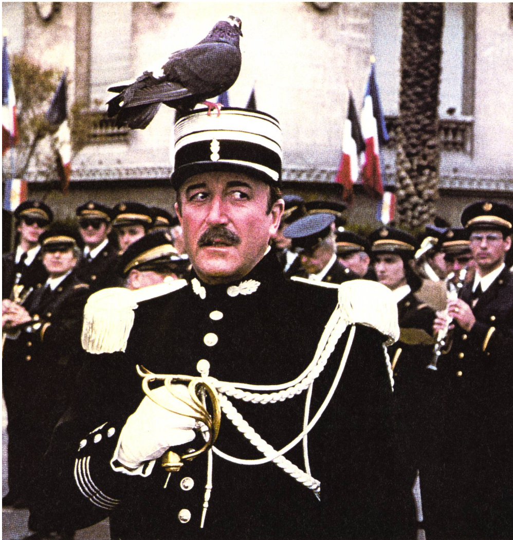
L'inspecteur Clouseau (Peter Sellers) dans « La malédiction de la panthère rose »

tourner aux États-Unis et réalise en Angleterre le très beau film d'espionnage « Top Secret » (« The Tamarind Seed »). Un nouvel échec commercial.