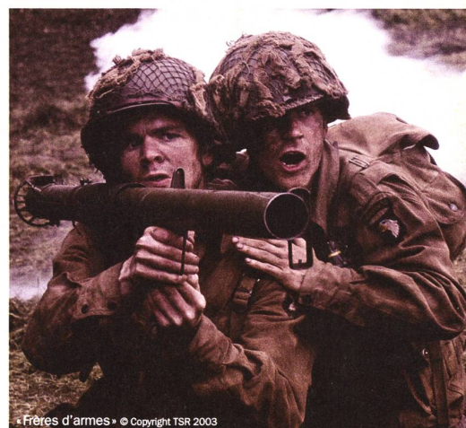
« Frères d'armes »