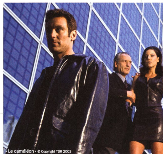
« Le caméléon »