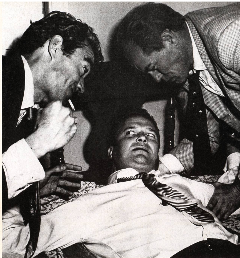
« En quatrième vitesse » de Robert Aldrich

Véritables bijoux réalisés par les plus grands, de Wilder à Welles, ces films, extrêmement travaillés dans leurs cadrages et leurs contrastes, n'ont pas seulement en commun le traitement de la lumière ou l'utilisation des bas-fonds urbains : l'humeur, elle aussi, y est des plus sombres. On meurt, on tue et on défigure à tour de bras, par exemple dans « Règlement de comptes » de Fritz Lang, dont le titre original, « The Big Heat », conservait toute leur chaleur aux séquences sadiquement jubilatoires de jets de café brûlant et de vitriol ! Au passage, on s'aperçoit que les légendaires « femmes fatales » sont souvent criminelles malgré elles... Difficile d'en vouloir à ces personnages profondément corrompus, puisqu'à travers eux, c'est la société tout entière qui est dénoncée. En cela, le genre s'inscrit en faux contre l'hypocrisie d'une Amérique d'après-guerre qui, tout en prétendant reconstruire un avenir radieux,