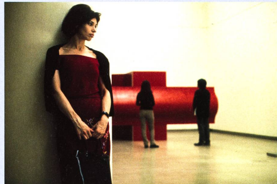
Béatrice Dalle dans «H Story» de Suwa Nobuhiro