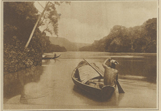
Auf ruhigem Wasser

Sie wohnen auf einer Rodung des undurchdringlichen Urwaldes, einige hundert Meter von einem kleineren Nebenflusse des Rio Paru entfernt. Die Hütten gruppieren sich um einen ungefähr kreisrunden und peinlich sauber gehaltenen Dorfplatz, um den herum die Wohnhütten der Männer stehen. Um das Dorf herum liegen die Felder: leichte Rodungen, auf denen vor allem Mandioka, dann Bananen, Ananas, Bataren und dergleichen Früchte gezogen werden. Dort arbeiten die Frauen täglich etwa eine Stunde lang, der Mann sitzt, wenn er überhaupt mitgekommen ist, müßig dabei auf einem Baumstamm, wohl um die arbeitende Frau und die Kinder gegen irgend welche Gefahr zu beschützen. Schwer beladen kehrt die Frau dann nach dem Dorfe zurück; der Mann folgt wiederum