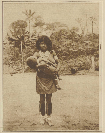
Mutter mit ihrem Kind

Eine eingehendere Reisebeschreibung wird im Herbst bei Streckler und Schröder in Stuttgart in Buchform erscheinen.