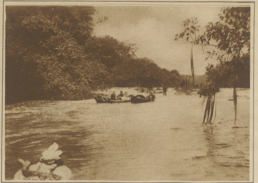
Nach dem Passieren einer der vielen Stromschnellen

übrigen Männer abhängig ist. Nächst ihm genießt am meisten Ansehen der Zauberarzt, der sich durch allerlei magische Mittel auch mit den Dämonen in Verbindung setzen kann, und als Arzt verehrt, als Zauberer gefürchtet wird. Die meisten Männer haben nur eine Frau, doch ist Polygamie erlaubt, aber nur die reicheren können sich mehrere Frauen leisten, und bei dem heutigen Welbermangel, der durch allerlei Seuchen entstanden ist, den die, wenn auch ganz geringe Berührung mit den Weißen gebracht hat, sind sehr viele Männer überhaupt nicht verheiratet, was für die weitere Existenz der Aparai von den schlimmsten Folgen sein kann. Die Frauen brauchen einen ihnen nicht zusagenden Mann nicht zu heiraten, und haben überhaupt eine angesehene Stellung. Die religiösen Vorstellungen der Aparai sind, wie bei allen Naturvölkern, nicht sehr klar. Sie glauben an eine große Anzahl von Dämonen,