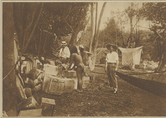
Unser Lager am untern Flußufer des Rio Paru

Dieser Fluß, der ungefähr die Größe des Rheines im Sommer haben mag, zeichnet sich vor andern südamerikanischen Flüssen durch seine besondere Unschiffbarkeit aus, reißt sich doch eine Stromschnelle, Caschoeira genannt, an die andere. Solche Schnellen finden sich immer an den Uebergängen eines Plateaus zum andern, zwischen ihnen liegen längere Strecken flachen Laufes, wo der Fluß sich dann in eine große Anzahl kleinerer Arme spaltet, während er an den Schnellen meistens in nur wenige Arme zerfällt, sich entweder wie ein Wildbach in schäumenden Wogen über wirt zerrissene Felsen ergießt, oder auf große Breite aufgelöst, als schimmerndes Geriesel mit nicht geringer Wucht über ein unebenes Felsbett strömt. Eine Urwaldreise bedingt Mitnahme eines nicht unbedeutlichen Gepäcks, es kann dies nur auf schweren Booten, Monterias genannt, transportiert werden. Sie sind ganz flach aus starken Planken gebaut, daher mit den Rudern mühselig zu regieren, müssen aber imstande sein, die vielen Stöße, denen sie beim Uebergang der Schnellen ausgesetzt sind, auszuhalten.