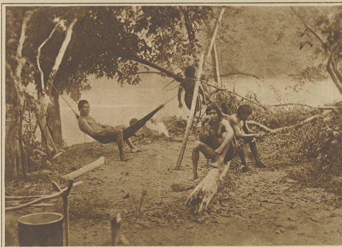
Männerhaus in einem Indianerdorfe

Mehrere Wochen lang wohnten wir in einem ihrer Dörfer: Tucano, in der Hütte des Häuptlings, und führten, soweit es für Europäer tunlich war, das gleiche Leben wie die Indianer. So lernten wir denn ihr materielles Leben ziemlich genau kennen.