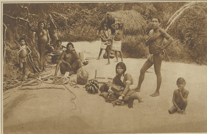
Ein Lager am Flußufer

Starr wie die Vegetation ist, scheint das Tierleben erstorben zu sein: wenige Vögel ver-