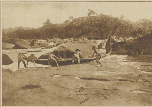
Bootziehen über die Felsen einer Stromschnelle

ohne eine Last zu tragen, höchstens daß er eines der kleinen Kinder auf dem Arme trägt. Zu Hause angekommen muß nun vor allem der blausäurehaltige Mandiokknollen entgiftet werden: er wird geschält, auf einem Reibbrett zerrieben, dann wird der dadurch entstandene Brei in das sogenannte Tipiti eingefüllt. Dies ist ein lose geflochtener Schlauch, der oben offen ist, an beiden Enden aber eine Schlinge hat. Mit der oberen Schlinge wird das Tipiti an einen Dachbalken aufgehängt, durch die untere wird eine starke Stange gesteckt, und beschwert. Dadurch wird der Schlauch in die Länge gezogen und sein Fassungsvermögen verringert sich beträchtlicher Weise; es entsteht ein starker Druck auf den Mandiokbrei, so daß der giftige Saft ausfließen kann. Läßt man den Zug lange genug wirken, so kann die ausgepreßte Mandioka als fester Zapfen aus dem Tipiti herausgenommen werden. Man zerbröckelt diesen und siebt ihn durch ein feines Sieb, das Mehl wird dann auf heißen Tonplatten zu einem Fladen gebacken: Beju genannt, der das Brot der Indianer darstellt, und wenn er frisch ist, wie ein frischgebackenes Brötchen schmeckt. Zum diesem Beju wird dann Schweinefleisch gegessen, wenn die Männer gerade Schweine erlegt haben, oder man ißt einen Iguana, oder Schildkröteneier, oder einen Brüllaffen, den man vor allem als