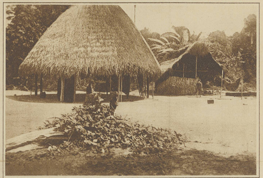
Unsere Begleiter bei der Mittagsrast

mögen die Unwirtlichkeit des Urwaldes nicht zu heben, nur in kleinen Exemplaren sieht man gelegentlich einen Alligator am Sumpfer liegen. Wild zeigt sich fast nie (wir haben einen einzigen Tapir gesehen und erlegt), auch Schlangen sind selten. Dagegen wimmelt der Fluß von Fischen; diese bilden eine willkommene und unentbehrliche Ergänzung der mitgeführten Vorräte, die vor allem aus Mandiokmehl (Farinha), Kaffee und Tabak bestehen müssen, wozu natürlich die Tauswaren für die Indianer zu zählen sind. Einige Aparai-Indianer hatten wir in Belm do Para getroffen, wohin sie durch Zufall gekommen waren. Mit ihnen und einigen Caboclos haben wir die Bergreise gemacht, und hatten uns über die Leistungen und die Freundlichkeit der Indianer nie zu beklagen. Anders wurde es dann allerdings in ihrem Dorfe, wo die einflußreicheren Männer unter ihnen sehr begierlich wurden, und sich auch weiter nicht an das uns gegebene Versprechen hielten, uns noch weiter den Fluß hinauf zu bringen.