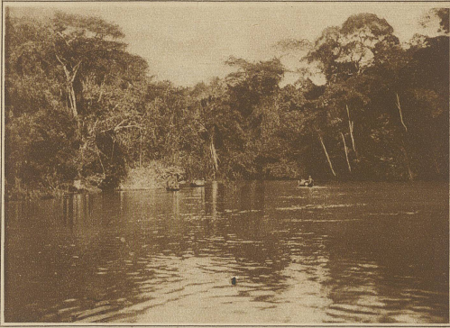
Im Urwald am Rio Paru

übrigen Männer abhängig ist. Nächst ihm genießt am meisten Ansehen der Zauberarzt, der sich durch allerlei magische Mittel auch mit den Dämonen in Verbindung setzen kann, und als Arzt verehrt, als Zauberer gefürchtet wird. Die meisten Männer haben nur eine Frau, doch ist Polygamie erlaubt, aber nur die reicheren können sich mehrere Frauen leisten, und bei dem heutigen Welbermangel, der durch allerlei Seuchen entstanden ist, den die, wenn auch ganz geringe Berührung mit den Weißen gebracht hat, sind sehr viele Männer überhaupt nicht verheiratet, was für die weitere Existenz der Aparai von den schlimmsten Folgen sein kann. Die Frauen brauchen einen ihnen nicht zusagenden Mann nicht zu heiraten, und haben überhaupt eine angesehene Stellung. Die religiösen Vorstellungen der Aparai sind, wie bei allen Naturvölkern, nicht sehr klar. Sie glauben an eine große Anzahl von Dämonen,