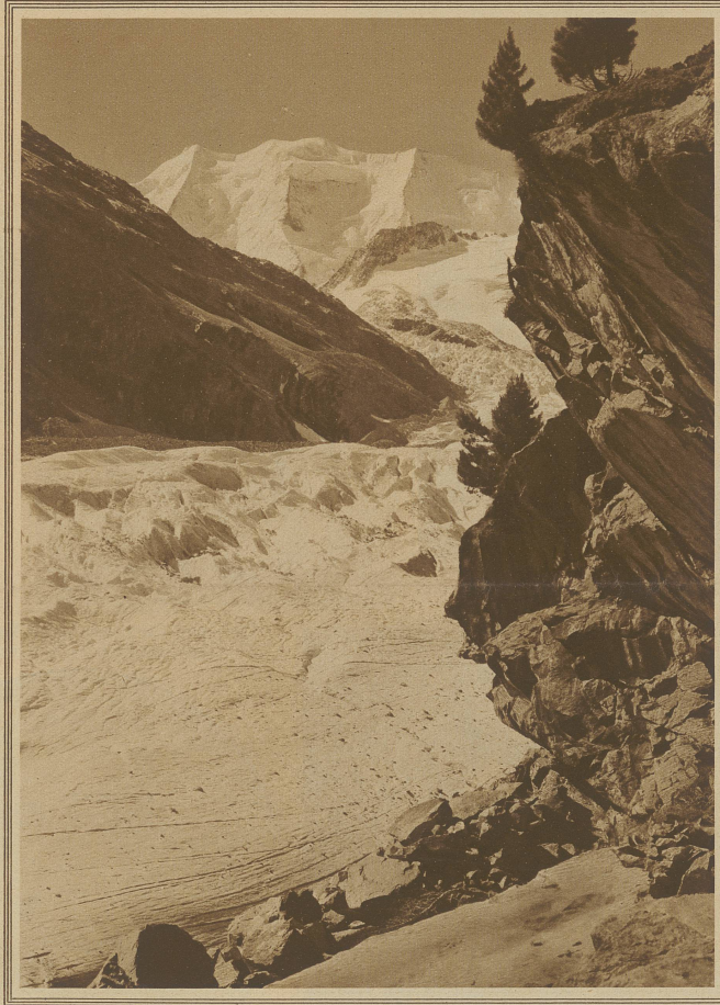
Piz Palù mit Morteratschletscher