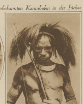
Unter unbekanntem Kanibal in der Südsee