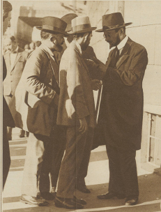
Internationaler Zionskongress in Wien. Eine Teilnehmungsgruppe aus Palästina