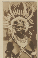
Die Frau eines Kambodscha-Häuptlings in Fankong