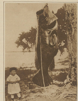
Der Herr wurde an die Küste von Florida ein paar Tage lang. Eine Bild aus dem ersten Teile der Serie in Verbindung mit dem darauffolgenden Jahr, 1921