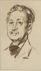
Plauer Reichen, Winterthur