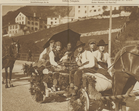
Bilder vom ersten internationalen Sozialistenkongress in Genè