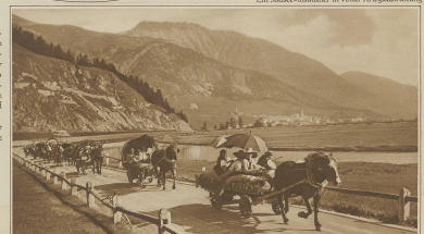
Auf dem heimlich geschmückten Hauptwagen... (Text is partially obscured)