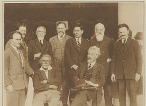
Die Delegierten der russischen Revolutionäre am internationalen Sozialistenkongress in Marcella