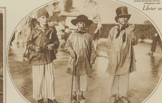
Als Bismarck... (Text is partially obscured)