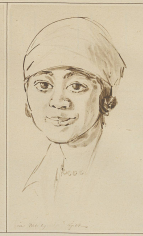
Eine malayische Delegierte