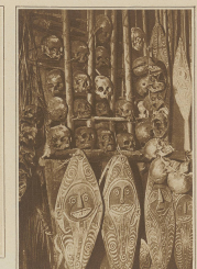
Stille, ungehörige, in einem tropischen Lande