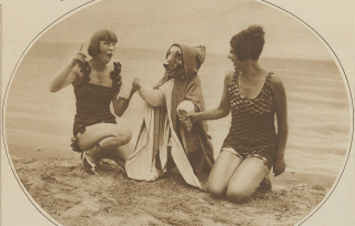
Ein sonniger Strand