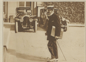
Marsden Louy, der leitende Kommandant der britischen Truppen in Marokko... (Text is partially obscured)