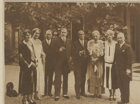
Der König von Ruanda... (Text is partially obscured)