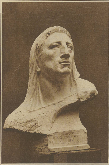
Melchtal Studie für die Gruppe des Rätli-schwarzes im Bundeshaus in Bern