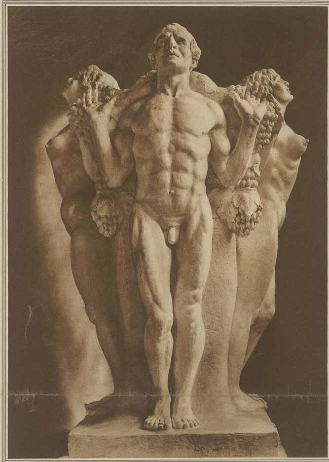
Die Zukunft Aufgestellt im Musée d'Art et d'Histoire in Genf