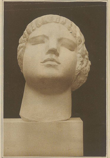
Die Muse Fragment der Gruppe «L'Effort Humain»

haben ihn hervorragende Bildnisse schaffen lassen. Wir denken zum Beispiel an den Kopf des französischen Dichters Paul Verlaine oder an die so ungemein zart durchgebildete Büste