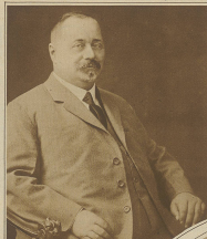
Der Schaffner des Luftschiffes, der die Maschine erfand.