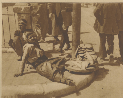
Bettelkinder an einer Straßenecke in Damaskus