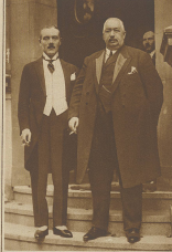
Die amerikanischen Missionen. Der amerikanische Konsul in Beirut und der amerikanische Konsul in Bagdad