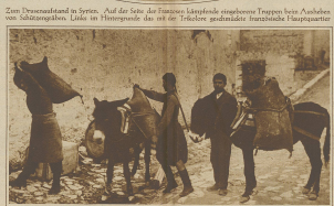
Zum Dreimächtebund in Syrien. Auf der Seite der Franzosen überführte stehende Truppen beim Anhalten von Soldaten. Links im Hintergrund die mit ein türkischer geschützter türkischer Transporter