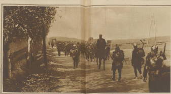
Zum griechisch-türkischen Konflikte. Griechische Infanterie auf dem Vormarsch