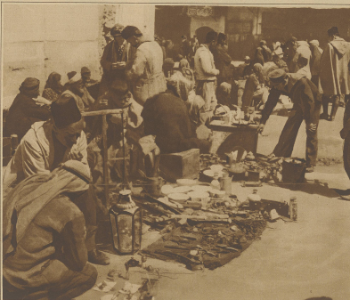
Damaskus. Straßenhändler bieten ihre Waren feil