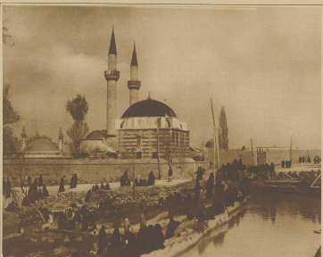
Vor der Moschee am Barada-Fluß im belagerten Damaskus