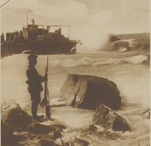
Der Fiskus in Mexiko. Wappenstein bei einem Meer an der Küste von Chiapas