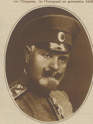
General Lazarus, der Oberbefehlshaber der griechischen Armee