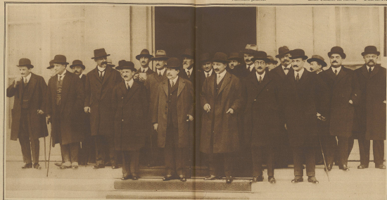
Das neue französische Kabinett. Ministerpräsident Poincaré in der Mitte