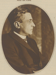
Stavros Karamanlis, der griechische Minister für auswärtige Angelegenheiten