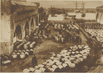
Vom griechischen Wein. Mächtige Weinlager im Hafen von Kanda auf Kreta