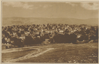
Zum griechisch-türkischen Konflikte. Bild auf die belagerte Stadt Beirut, die von den Griechen besetzt wurde