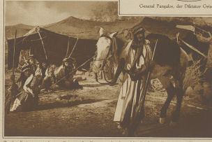
Zu den Ereignissen in Syrien. Ein mit den Thronen verbrannte, durch deren Truppen von den Franzosen nach Beirut Karavane zurückgeschickt wurde