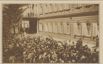
Zum griechisch-türkischen Konflikte. Das Volk begrüßt den Zaren vor dem Palast in Sofia