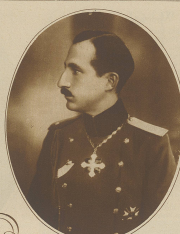
Zur Seite von Bulgarien