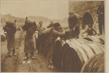
Vom griechischen Wein. Der Rebensaft wird aus den Trauben in Fässer gefüllt