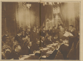
Die außerordentliche Sitzung des Vollparlamentes zur Befassung des griechisch-bulgarischen Konfliktes