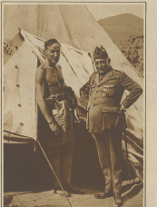
Wieder die amerikanische Mission in Beirut. Der amerikanische Konsul in Beirut und der amerikanische Konsul in Bagdad