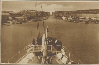
Der Kanal von Kairo, der an den ersten Kriegen zerstört wurde, ist nun wieder soweit in Ordnung gestellt, daß er für die Schiffe für gegeben werden konnte. Linien 188 zeigt die Lokalen in dem Kanal