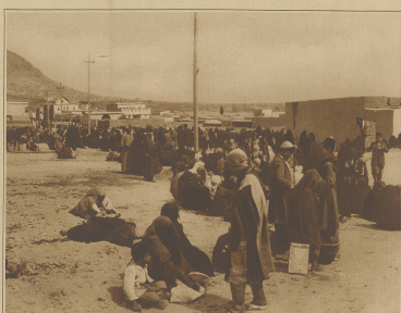
Das Leben der Bevölkerung vor der Stadt Damaskus