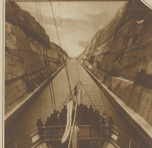
Zur Wiederrichtung des Kanals von Kairo. Ein Schiff auf der Fahrt durch den Kanal