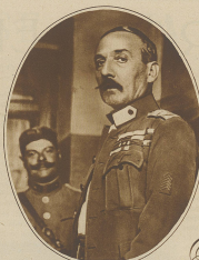
General Pando, der Ökonomie Consul-General