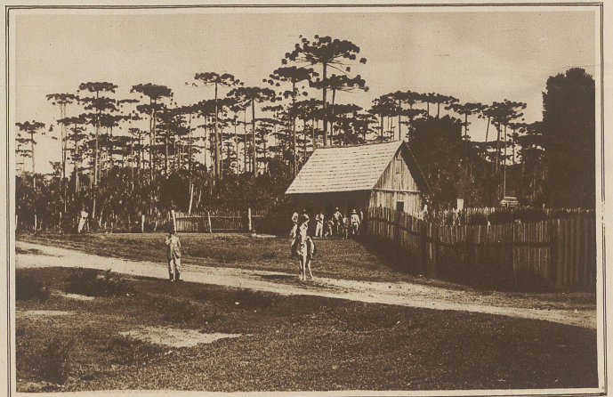
Vor dem Schutzhaus einer Farm, die mitten in einem prächtigen Pinienwalde liegt

Inzwischen ist es Tag geworden, und der Zug fährt durch die letzten, flach kriechenden schwarzen Sümpfe der Mongrovenwälder, um dann ein wenig bergan durch die hügelige Urwaldlandschaft zu klettern. Hinter der Station Bannal aber — hinter den ausgedehnten, saftgrünen Bananenpflanzungen — beginnt die Lokomotive gewaltig zu klimmen; denn hier beginnt das Gebirge, die Serra do Mirador. Wir halten zuweilen an den kleinen Ortschaften, und meine Reisegefährten überfluten dann den winzigen Bahnsteig, um die nötigsten Vorräte — Tabak, Früchte und Weißbrot — zu ergänzen und um einen starken, schwarzen kleinen Kaffee zu trinken. Manchmal stoppt aber auch die Maschine auf einsamer Strecke an einem Wasser-