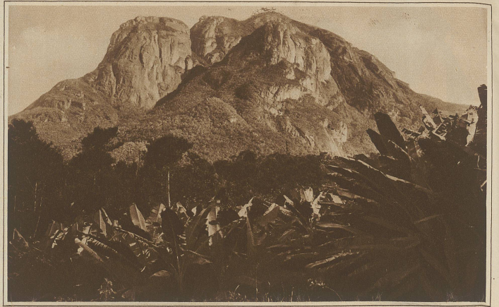
Blick aus dem fahrenden Zuge auf die üppige Vegetation. Im Hintergrund ein charakteristischer Höhenzug aus dem brasilianischen Hochland

werfen sie die leergegessenen Stränge hinter sich zum Fenster hinaus. Bei allem geben sie auf ihre hellen, bunten Kattunkleider wohl acht. Das Mädchen neben mir bietet mir mit freundlichem Lachen eine Zuckerrohrstange an und ich beginne ebenfalls zu essen. Sie ist eine recht hübsche Negerin, was man so hübsch nennt, wenn man schon von einem Aufenthalt im Innern Afrikas her an Negergesichter gewöhnt ist. Die Nase ist zwar breit und aufge-