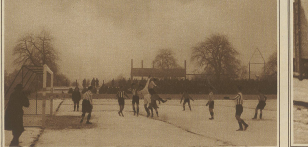
Eine Ecke vor dem Tor der Zürcher.