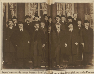
Briand tritt mit dem neuen französisch-belgischen Kabinett nach der großen Finanzdebatte in der Kammer.