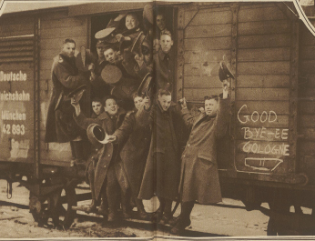
Der Abzug der Besatzungsmächte aus Köln. Englische Soldaten anbieten der Bevölkerung für Lebensmittel.