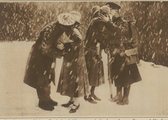
Zur Räumung Kölns. Englische Soldaten verabschieden sich von Frau und Kind.