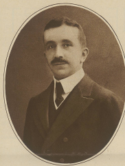
Minister von Salfer, der abwärts, Obergewaltigkeit und Bildung, ist nun auch im Jahre abgewandert.