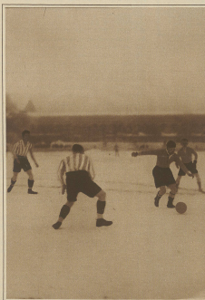
Honessler schließt an Erwanger vorbei.