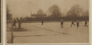
Crashoppers - Zürich. Das erste Tor gegen Zürich.