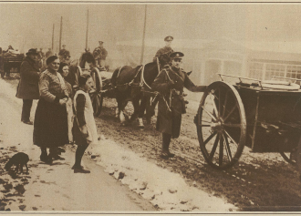
Zur Räumung Kölns. Der Abzug der englischen Truppen.