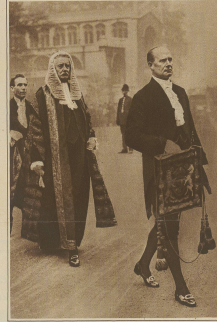
Zur Entlassung des englischen Staatspräsidenten in London. Der Lordkanzler Viscount Cave, kehrt von der Westminster-Haus zum Platz der Lords zurück.