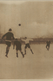
Blue Stars - Aarau. Aarau Torwart befreit.