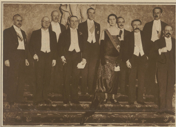
Zur Unterzeichnung der Verträge von Locarno. Die bevollmächtigten Minister aus Belgien, Frankreich, Italien, England, Spanien, Portugal, Griechenland, Jugoslawien, Litauen, Lettland, Estland, Finnland, Dänemark, Schweden, Norwegen, Polen, Tschechien, Jugoslawien, Rumänien, Griechenland, Türkei, Albanien, Serbien, Kroatien, Ungarn, Litauen, Lettland, Estland, Finnland, Dänemark, Schweden, Norwegen, Polen, Tschechien, Jugoslawien, Rumänien, Griechenland, Türkei, Albanien, Serbien, Kroatien, Ungarn.