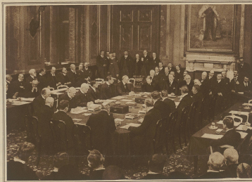
Die förmliche Schlussfeier zur Unterzeichnung der Verträge von Locarno im englischen auswärtigen Amt in London.