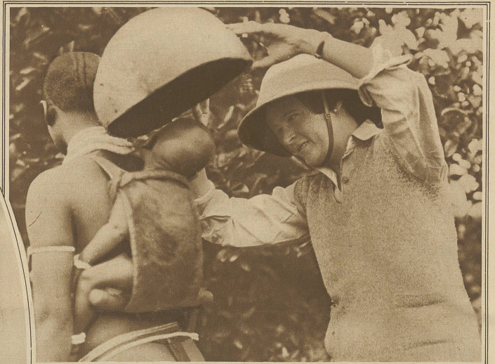
Die Negerfrauen tragen ihre Kinder in einem besonderen Traggestell auf dem Rücken. Zum Schutze gegen die Sonne wird der Kopf des Kindes mit einer Schale zugedeckt