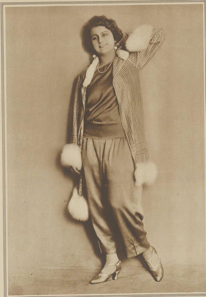
Frauenschönheit und Mode

Die bekannte Sängerin Inge Lyn in einem neuartigen blaß-rosa Charmeuse-Pyjama mit Jacke aus geripptem Samt mit weißem Maraboubesatz