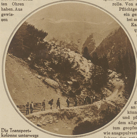
Die Transportkolonne unterwegs

Am 20. Juni traf ich in dem romantischen Bündner Dörflein Bergün mit einer kleinen Gesellschaft zusammen. Wir hatten etwas ganz Wichtiges vor. Darum saßen wir so ernst und feierlich beisammen. Es wurde fast nur im Flüsterton gesprochen. Die Wände konnten Ohren haben. Aus gewissen