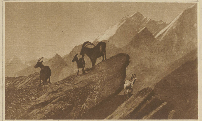
Bastarde. Eine Kreuzung zwischen Steinbock und Ziege

Wildreichtum zeugten. Tannenhäher rätschten. Wacholderdrosseln und Bergfinken, Erlenzsige und Goldhähnchen waren zugegen. Weiter oben fand ich Wölfe von einem Schneehasen. Eine Birkenhenne strich vor mir ab. Und als wir oben auf dem Plateau anlangten und behutsam unsere