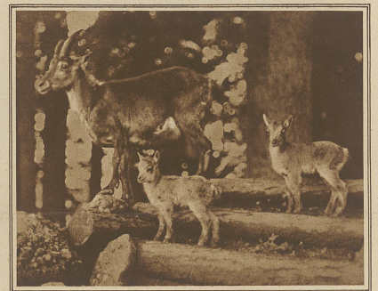
Steinbockgeiß mit jungen Zwillingen

Köpfe in die Höhe schoben, entdeckten wir bald ein starkes Rudel Gamsen, bei dem ich mindestens dreißig bis vierzig Stück zählte. Es waren fast alles Muttertiere mit kleinen, aber äußerst munteren Kitzen, deren Alter ich auf etwa drei Wochen schätzte. Schließlich waren wir von allen Seiten von flüchtigem oder herumziehendem Krickelwilde umgeben. Da hörten wir einen warnenden Pfiff, dort steinelte ein Bock vorbei, es