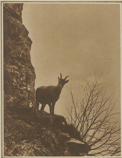
Steinbock im Gebiet der Grauen Hörner im St. Galler Oberland

Wir sind fast alle Jäger. Sonderbar! Ausgeklügelt diese Grünröcke betätigen sich an der Aussetzung von Steinwild, sie, die sich in der Jagdzeit mit Büchse und Flinte in den Bergen herumtreiben, um das flüchtige Gratier, den flinken Schneehasen oder den heimlichen Spielhahn zu erlegen. Heißt das nicht in Paradoxien machen und die vernünftige Weltordnung auf den Kopf stellen! Halt, — der weidgerechte Jäger, er dem es nie und nimmer ums Ausrot-