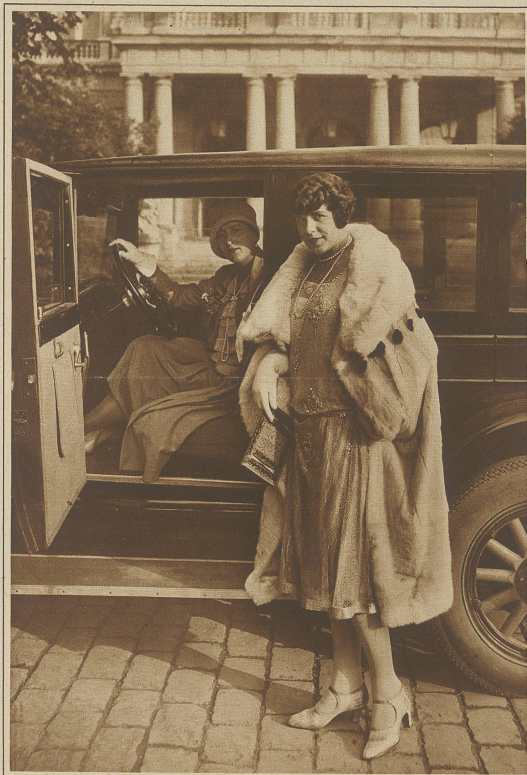
Das vornehme Reitkleid

Wie gerne begegnet man einer Amazone, wenn sie vom Morgenritt taurisch und angeregt zurückkehrt, den schwarzen, weichen Filzhut auf dem Lockenkopf, die fesch geknotete weiße Krawatte lustig im Winde flatternd. Daß sie den Herrensattel wählt, ist selbstverständlich. Die anliegende Jacke mit glockigem Schoß, der gefällige Falten wirft, betont genügend das Feminine der Trägerin.