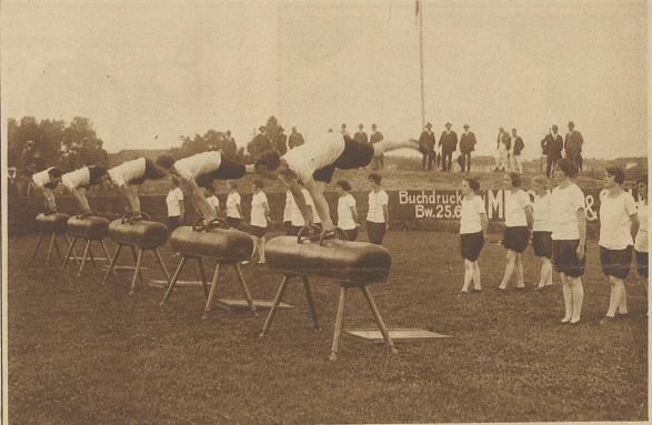
Schweiz. Arbeiter-Turn- und Sportfest in Bern