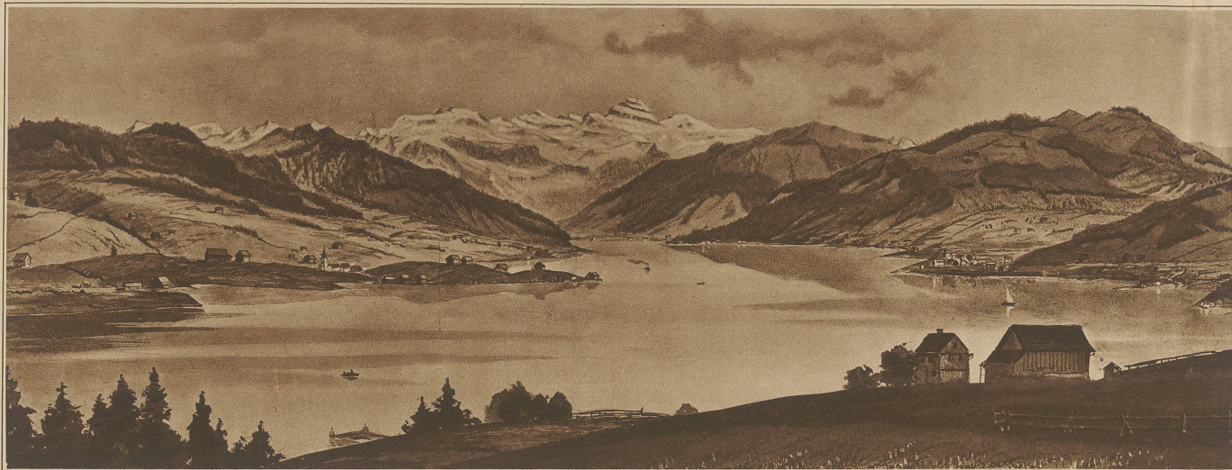
Gesamtansicht des projektirten Sihlsees