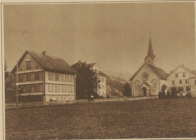
Willerzell, dessen Kirchlein ebenfalls nahe ans Seeufer zu stehen käme

reiche des zukünftigen Stausees wohnen 510 Personen. Von diesen sind 364 (71%) hauptberuflich in der Landwirtschaft tätig. Das Stauseegebiet hat eine Volksdichte von 44. Der Umstand, daß große Teile des verödenen Sihlseebeckens wirkliches Oedland darstellen, und daß, im Hinblick auf das kommende Stauwerk, im Verlauf der letzten Jahrzehnte keine Maßnahmen