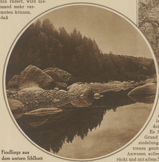
Findlinge aus dem untern Sihlbett

dieser große Weiher Kirchen, Wohnstätten, blühende Matten, Erdäpfeläcker, Torf- und Streufelder, die Heimat vieler Menschen deckt. Niemand! — So gut paßt er in die Landschaft. Ein lustiges Völklein, das hier seit alten Zeiten lebt und liebt, soll dem See zulieb, der dem Vaterland größere Unabhängigkeit vom Ausland verspricht, das Opfer des Auszuges bringen. Hatten ihre Vorfahren auch schon solche Bürden vaterländischer Gesinnung zu tragen gehabt? — Aber ihr Fortgang aus dem werdenden See-