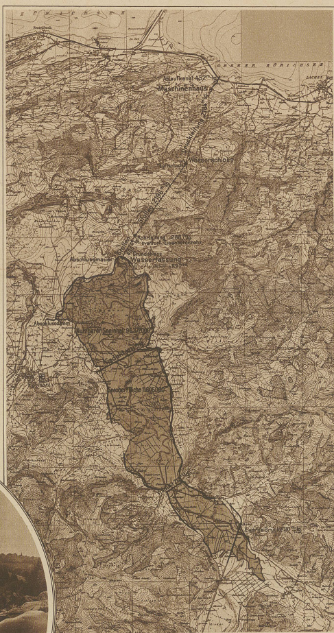
Uebersichtskarte des geplanten Egelwerkes