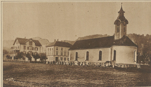
Das Kirchlein von Groß, das hart ans Seeufer zu liegen käme

«Wie schön isch au, wän d'Sunne chunt, Die groe Näbel styged, Und Nacht und Sorg wie Fastegwühl Am Ostertag verflüged!» «Juhui!»