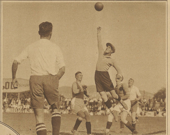
Der Torhüter des Sportclubs Freiburg in Verteidigung