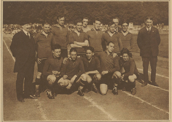
Die tapfere belgische Mannschaft wurde erstmals von den Schweizern besiegt 5 : 2