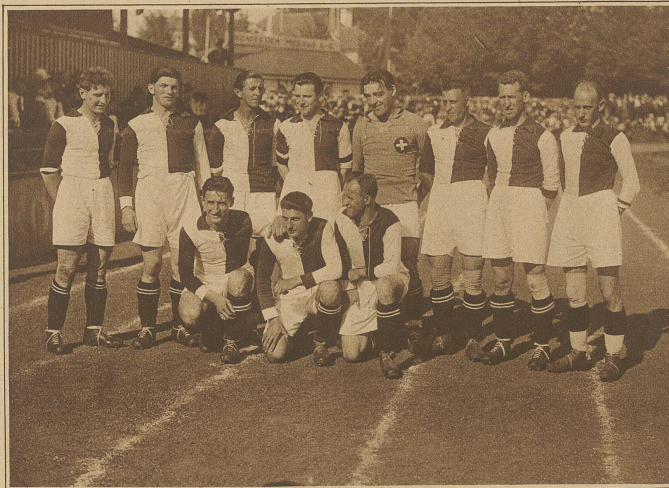
Die siegreiche Elf der Schweizer