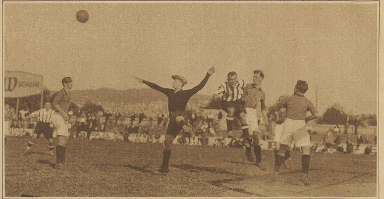
Momentbild aus der Begegnung zwischen Young Fellows und Sportclub Freiburg i. B.