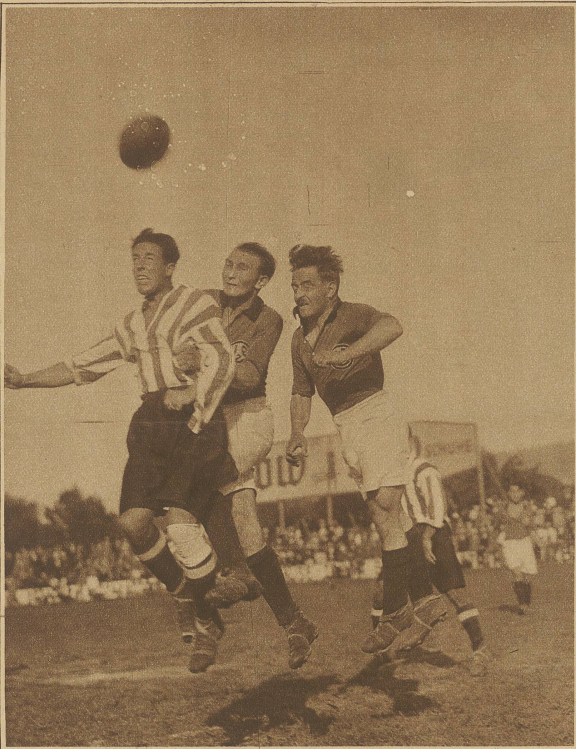
Rassige Verteidigung der Young Fellows gegen die Stürmer des A. C. Bilbao