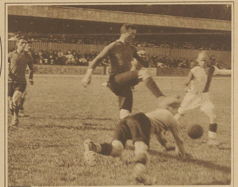
Kampfszene vor dem belgischen Tor