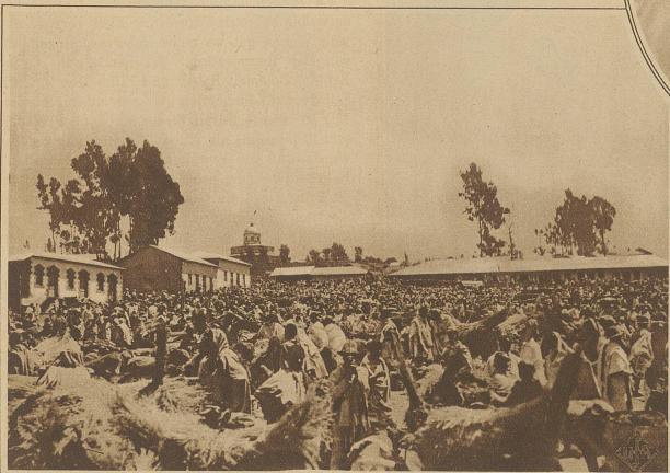
Markttreiben in Aethiopien

Nun geht es dem Omofuß entlang in schaurigwilde Gebirgsschluchten hinein, welche die nagende Tätigkeit der wasserreichen Flüsse im Laufe langer Zeiträume gebildet hat. Der durch Regenströme hochgeschwollene Omo stürzt an einer Stelle unter donnerndem Getöse über eine mehr als 1000 m hohe Felswand in die Tiefe. Hier ist ein wahres Paradies für die herumschwimmenden, geschickt tauchenden Flußpferde. In der Nacht steigen sie ans Land und zerstampfen mit ihren plumpen, kurzen Beinen, was in ihre Nähe kommt, während sie dabei Un-