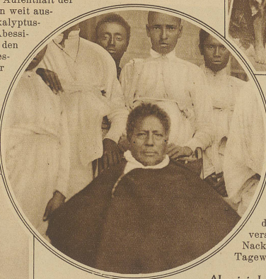
Abessinischer Minister im Kreise seiner Mitarbeiter

Gewaltige Anstrengungen kostet es, bis die Expedition mit ihren zahlreichen Dienern und Tieren ihr vorgestecktes Ziel erreicht und ihre Riesenaufgabe gelöst hat. Mit reicher Beute, die den Wissensdurst in der Heimat stillen soll, treten wir den Rückmarsch an. Groß ist die Freude, als die Zinnen der Stadt Addis Abeba in Sicht kommen, wo die wohlverdiente Ruhe von den vielen Strapazen winkt.