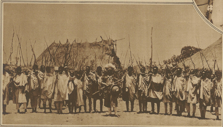
Eingeborene Krieger beim Gottesdienst

200 Festtagen jährlich und im Klosterleben zum Ausdruck kommt.