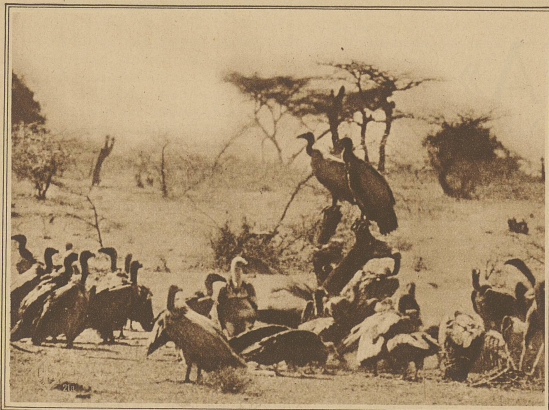
Aasgeier sammeln sich um die Beute