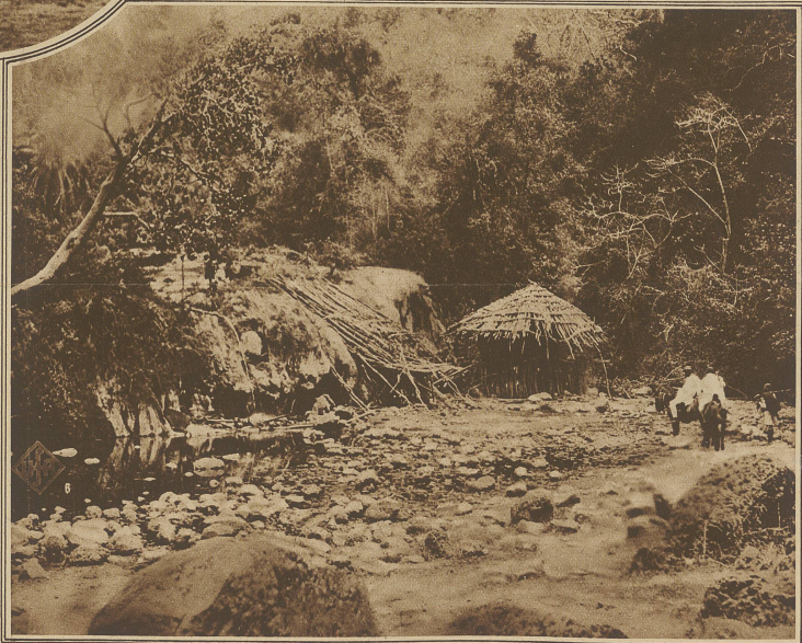
Eingeborenen-Hütten inmitten des Urwaldes