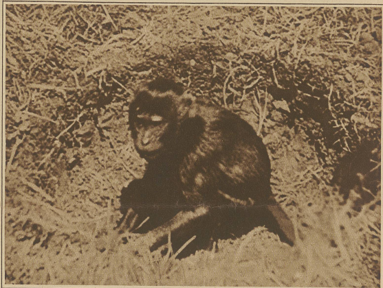
Idyll aus dem äthiopischen Urwald

Mit der äthiopischen Eisenbahn begeben wir uns mit der Expedition von Djiputi nach Dire-