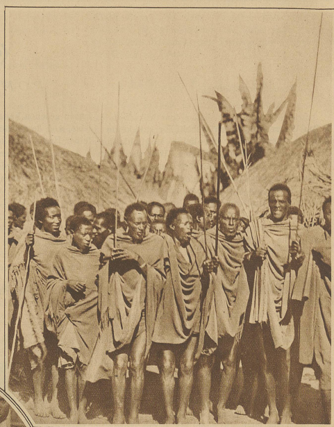
Eine Gesellschaft fröhlicher Kriegerleute

In prächtig wechselvollen Bildern reihen sich die beobachteten Erscheinungen, die uns den ganzen Zauber der Tropenregionen mit all den intimen Reizen der Landschaft und der dazu gehörigen, seltensam abgestuften Pflanzenwelt und den eigentümlichen Formen der afrikanischen Tierwelt vor das erstaunte Auge führt, zu einem herrlichen Ganzen zusammen. Wir sehen an Abassisee unter himmelanstrebenden Palmen rhythmische Sydamotänze aufzuführen, afrikanisches Wild im Schatten des Papyrus-Waldrandes äsen, fremdartige Vögel in den Lüften kreisen, den genügsamen Eingeborenen