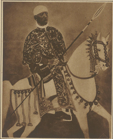
Wandgemälde im kaiserlichen Palast von Addis-Abeba