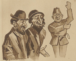
«Wos schauste, Schmule?» «E halbe Stunde zerbrech ich mir den Kopp, mit wem redd der Mensch!»

Aus der Affäre gezogen. Bei dem Versuch, seinen Rekruten eine Schwenkung zu zeigen, fiel der dicke Feldwebel auf dem nassen Boden in seiner ganzen Länge hin.