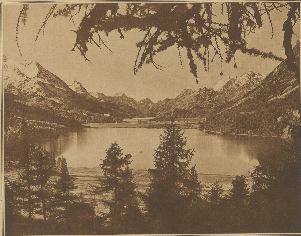
HERBSTSTIMMUNG AM SILVAPLANERSEE

Als er des Morgens müde und schier krank vor Zweifel, Verwirrung und Liebe zur Messe stieg, wollte ihm die junge auferstandene Welt so schön erscheinen, daß er sterben zu müssen meinte, sollte er dieses Tal verlassen. Und er betete inbrünstig und andächtig vor dem Madonnenbilde auf dem Altare, bis aus dem kleinen Turm das Ostergeläute über das Tal zu schwingen begann und das auf der Höhe lagernde Volk langsam in die Kirche drängte. Wenn viele auch später von diesem Ostagertage zu sagen wußten, daß es ihnen schon beim Betreten des Kirchleins so festlich und eigen gewesen sei, als stünde an diesem Morgen etwas besonderes bevor, und manche dies gar schon von dem Aufstieg erzählten, so war an dem Hochamte, zu dem die Buben und Mädchen vom Chore sangen, nichts Ungewöhnliches und selbst während der Predigt nichts zu bemerken gewesen, als daß der Pfarrer absonderlich bleich und traurig war. Da wares, als Remigius nach beendeter Gottesdienste sich vor dem Marienbilde neigte und noch einmal das Rauchfaß schwang, daß das Besondere begann. Das weiße Wölklein, das von dem silbernen Gefaße aufstieg, entschwebte