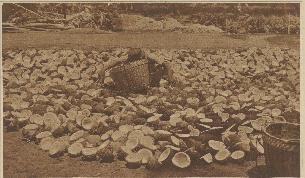
Trocknen aufgeschlagener Kokosnüsse

den sich in chinesischen Händen. Die Chinesen sind hier sehr zahlreich vertreten und meist mit Moro- oder Philippinofrauen verheiratet. Ich sah nur vier chinesische Frauen. Das Hauptprodukt bilden Perlmuttereschalen und Kopra. Die Moros verkaufen an die Chinesen die ganzen Kokosnüsse, während die Chinesen durch Aufschlagen der Nüsse die weitere Verarbeitung zu Kopra vornehmen. Auch ein eigenartiger schwarzer Fisch, Jisi genannt, bildet einen ziemlich großen Handelsartikel. Dieser etwa 1-1½ Hand lange Fisch schwimmt dicht unter der Oberfläche des Wassers und kann darum von den Moros leicht gefangen werden. Die Moros verkaufen ihm an die Chinesen, die ihn trocknen und räuchern, um ihn in diesem Zustand entweder nach China zu exportieren oder wieder bei den Moros gegen andere Artikel auszutauschen. 75% des ganzen Geschäftes in Jolo liegen in chinesischen Händen. Die Chinesen, die hier von den Moros alle Arten von Fischerei- und Agrikulturprodukten etwa 150% unter Preis kaufen, machen recht gute Geschäfte und werden in verhältnismäßig kurzer Zeit wohlhabend. Von der amerikanischen Regierung wird für eine Reihe von Jahren unter den Noblen der Moros ein Sultan und ein Premierminister gewählt. Der Sultan hat das Recht, Befehle und Erlasse für seine Stammesgenossen zu erteilen, Gerichte abzuhalten und kleine Strafen zu verhängen. Im allgemeinen fürchten die Moros diesen Sultan außerordentlich und fügen sich seinen Erlässen.