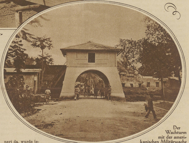
Der Wachturm mit der amerikanischen Militärwache

nert da, wurde jedoch nicht angerührt. Der Mann war im Nu von den erbitterten Soldaten erfaßt und in wenigen Sekunden buchstäblich in Fetzen gehauen. Auf ähnliche Weise sind eine ganze Anzahl Soldaten innerhalb kurzer Zeit ermordet worden.