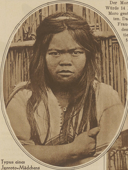
Typus eines Joroto-Mädchens