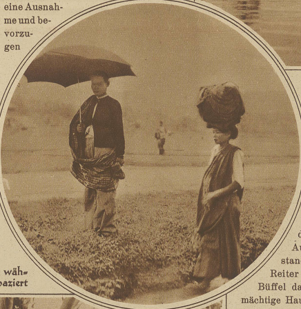
Die Frau trägt auf dem Kopfe eine schwere Last, während ihr Mann mit dem Sonnenschirm nebenher spaziert

gebrauten Schnaps anpreisen. Kaum habe ich meine Momentkamera zur Aufnahme bereit, als auch schon die ganze Gesellschaft unter den Tisch verschwindet, während der Rest sich hinter den Tischbeinen versteckt. Das größte Geschäft scheinen die Händler mit Betelnüssen zu machen, denn alles kaut, ganz einerlei, ob jung oder alt, Mann oder Weib, nur die kleineren Kinder machen eine Ausnahme und bevorzugen