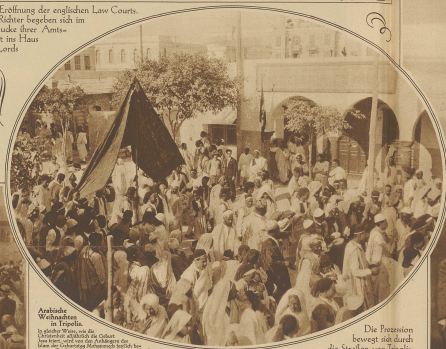
Arabische Weibchen in Tripolis.