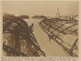
Wörter auf dem Wasser. Das Bild zeigt die ersten Heffeln, die nach einer Reise von annähernd 2000 km im Hafen von San Diego (Kalifornien) absteigen. Es sind dies die größten Fliegerei der Art.