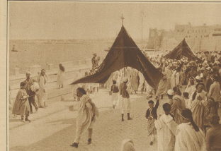
Arabische Weibchen. Die Prozession am Hadschtag in Tripolis.