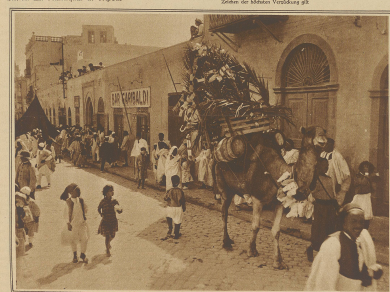
Arabische Weibchen in Tripolis. Ein mit Palmenzweigen und bunten Papieren geschmückter Kamele wird der heiligen Prozession vorangeführt.