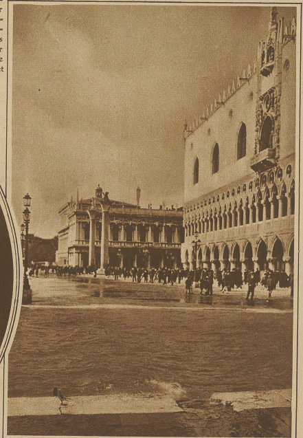
Auch Venedig hat unter dem Hochwasser der letzten Woche schwer gelitten. Unser Bild zeigt die seltene Aufnahme des überschwemmten Markusplatzes, der stellenweise nur auf Stegen passiert werden konnte