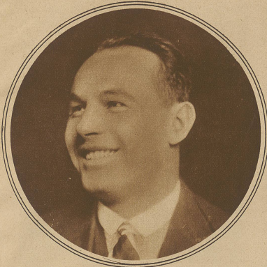
Jan Kiepura, dessen sensationelle Gastspiele an der Wiener und Berliner Oper ihm den schmeichehaften Titel des Nachfolgers von Caruso eingetragen haben. Kiepura ist polnischer Student