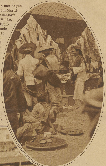
Wertvolle Seidenstoffe und minderwertiger Plunder werden in schönster Harmonie nebeneinander aufgestapelt

gebung, in welche man dabei gerät. / Alle uns soge-nannt bekannten Volkstypen lernt man unter den Markt-besuchern kennen: Fakire in ihrem grauenhaft ver-wahrlosten Aeußern, Bettler aus dem Volke, behangen mit allem möglichen Flitter und Plunder, in ihrer Erscheinung ehrfurchtgebietende Bettelmönche, den berühmten Gabennapf, der stets so rasch wieder von frommer Bevöl-kerung gefüllt ist, in Händen. / Unter freiem Himmel kauern in melerischem Durcheinander auf der Erde die Klein-händler, die ihr ganzes Verkaufsgut in Körben und Tüchern täglich anschlep-pen und als unzählige, lebende Murillo-bilder ein künstlerisch eingestelltes Auge stets aufs neue begeistern. / Es kann sich nicht satt sehen an der stil-vollen Musterung der Gewänder, sei es nun der gebatikte Sarong und das Kopf-tuch der Javaner, der aus wundervoll fallender, glänzender Seide verfertigte Potzo und Lungl der Birmanen mit dem in lichte Stoffe sonnenwirkungs-gleich eingewebten Goldschimmer oder das reiche Falten-gewand der Inderin, der weiche Spitzenschleier der Parsin. / Man staunt