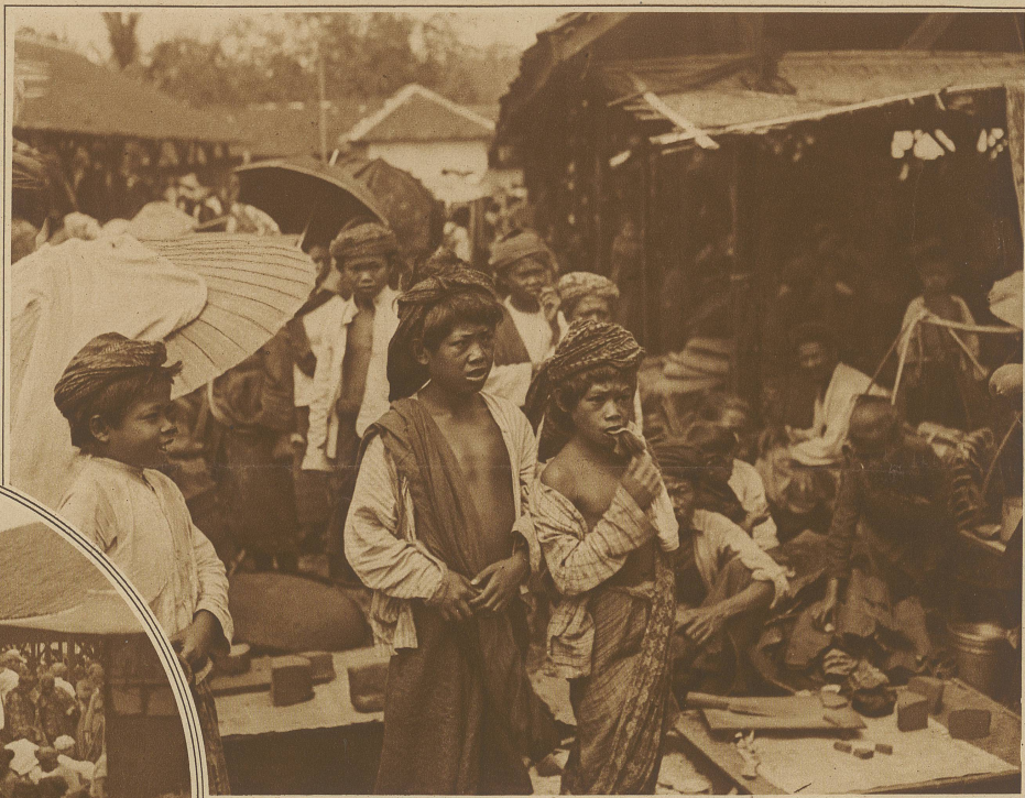
Marktleben in Garoet auf Java

Da befindet er sich mit einem Schlage im Mittelpunkt lebendigen, echten Volkstums. Nirgends sieht man den Eingeborenen sich freier bewegen, nie aufgeschlossener in der Bereitwilligkeit, dem Fremden nationale Eigenheit zu zeigen und zu erklären. Will man der Zutraulichkeit noch einen besonderen Anreiz geben, dann wählt man zur Unterhaltung nicht die Sprache des kolonialen Beherrschers, sondern die Ursprache der Landeseinwohner. / Die schauspieler oft mehr, als man schlechthin annimmt, wenn sie sich auf Fremdeneffekt einstellen oder von Europäern einen Vorteilerringen wollen.