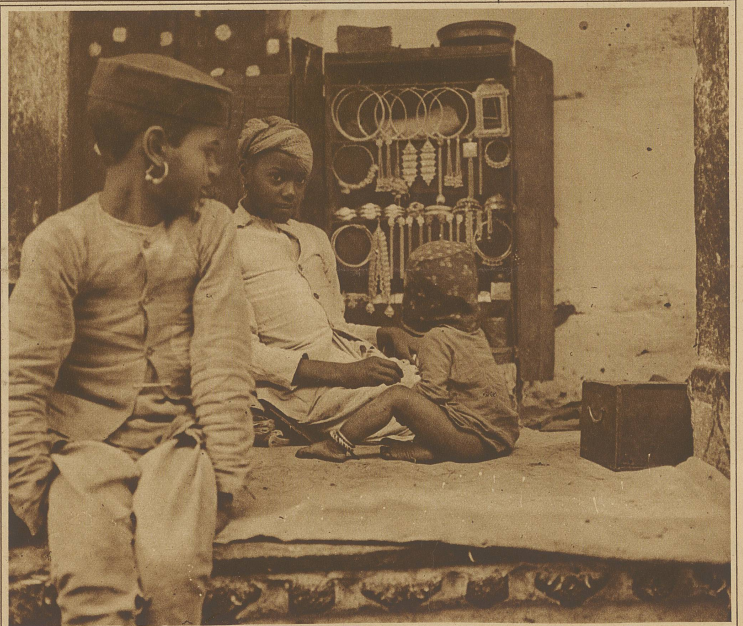
Juwelierladen in Udaipur