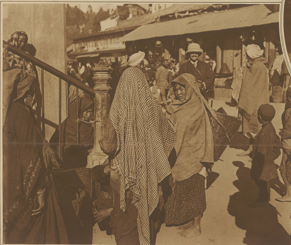
Malerischer Winkel auf dem Basar in Dardjeeling, am Fuße des Himalaja

Man beachte seinen grauenhaft verwahrlosten Zustand