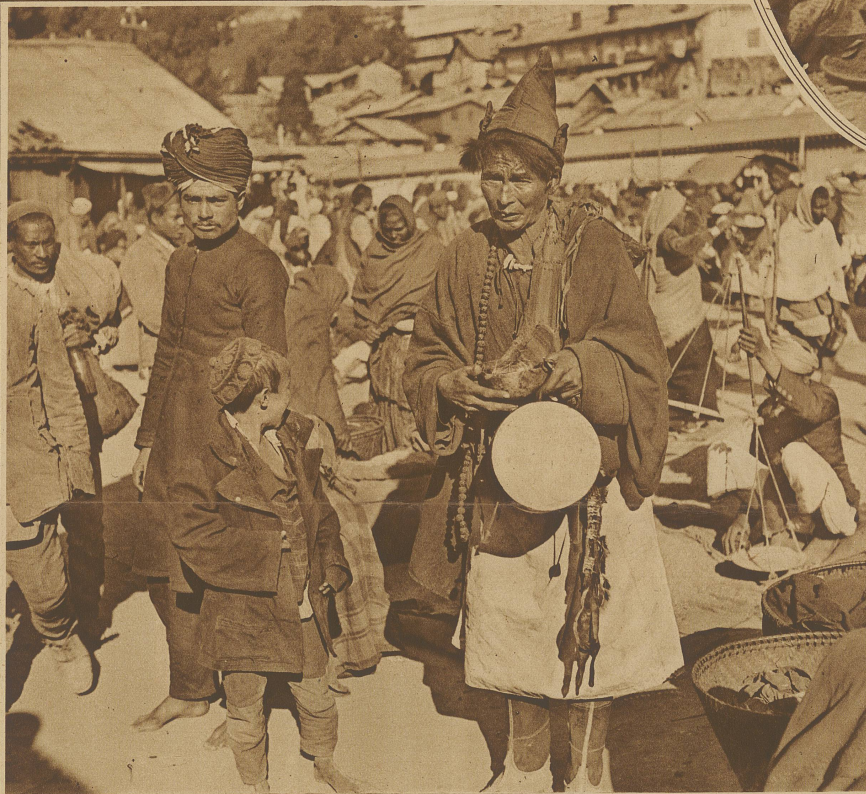
Buthiabettler in Dardjeeling, der die Konjunkturzeit des Basars auszunützen weiß

Es ist unendlich bedauerlich, daß die photographische Technik noch nicht so weit gedieh, Platten auf den Markt zu bringen, die solchen vom Himmelslicht verklär-ten, orientalischen Farbensinn-reichtum und Geschmack aufneh-men und in Kopien wiedergeben können. Worte, seien sie auch von tiefster Begeisterung getragen und von lebendigster Phantasie auf-genommen, werden es doch nie ver-mögen, von dem derart Geschauten auch nur einen annähernden Be-griff zu geben.