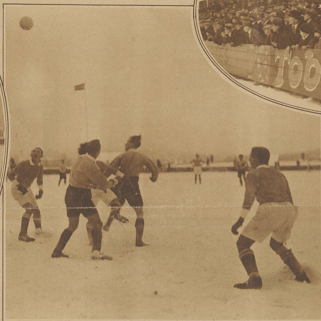
Kampfmoment aus dem Spiel