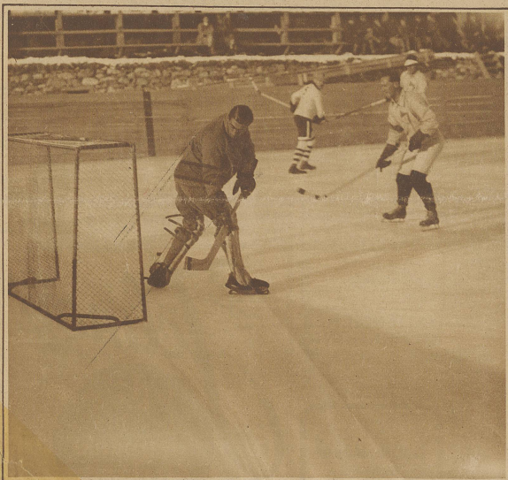
Schon nach 30 Sekunden sitzt das erste Tor gegen die Schweizer