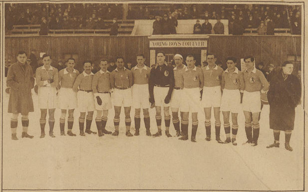
Die Zürcher Städtemannschaft