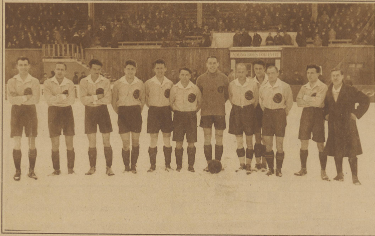
Die siegreiche Mannschaft Berns