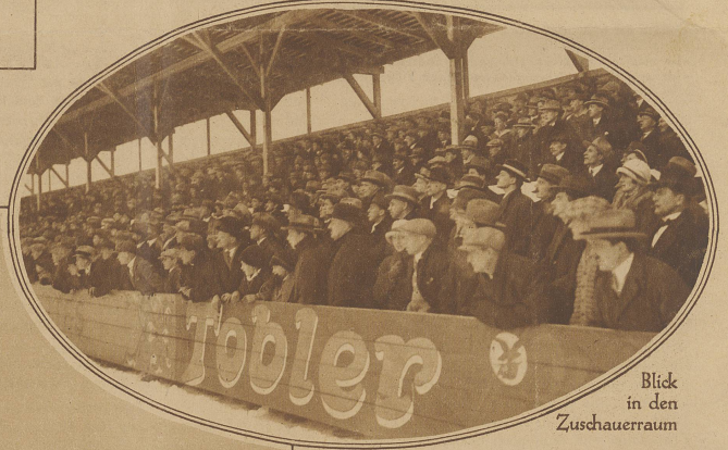
Blick in den Zuschauerraum