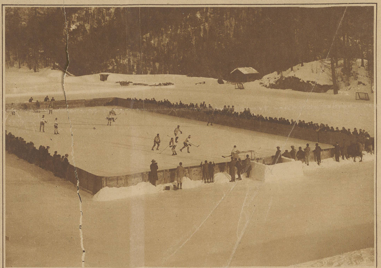
Die Schweizer erzielen das 7. Tor