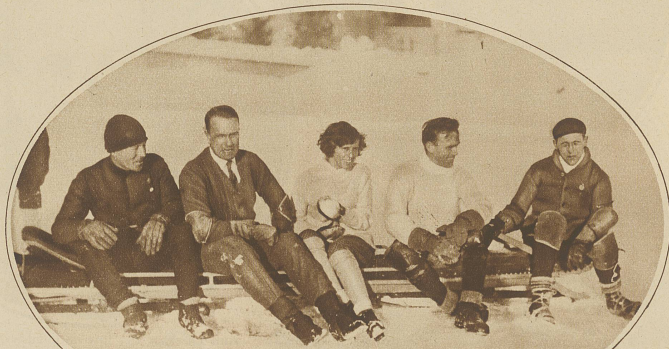
Die verunglückte Mannschaft, die, trotz der ungeheuren Fahrgeschwindigkeit im Moment des Unglücks, mit verhältnismäßig leichten Verletzungen davonkam

zen, zurück,» kündete er an. «Als dieses Gewitter losbrach, fühlte ich, daß es mir Unheil bringen werde. Es ist schlimmer geworden, als ich habe ahnen können. Ich kann nicht mehr. Ich muß gehen.» «Sie wollen also nicht singen?» fragte Madame. Er schlug die Arme übereinander, schloß die Augen und schauerte zusammen. «So können Sie einen populären Vorstadttenor fragen, ob er sich für einen Bazar zur Verfügung stellen wolle,» seufzte er. «Ich bitte Sie, Madame, lassen Sie sich von jemandem raten, der Fachmann ist. Erzählen Sie ihm, was Sie getan haben und folgen Sie seinem Rate. Ich bin nicht beleidigt, ich bin nur außer mir.» «Das Programm,» erklärte Madame ruhig, als er zum Abschied eine tragikomische Verbeugung inszenierte, «wird nächste Woche gedruckt. Sie wissen, was Sie zu tun haben, wenn Sie Ihren Verpflichtungsschein haben wollen. Hugh, sorgen Sie für Herrn Rapastos Wagen.» Hugh und Claire gingen auf die Terrasse hinaus, um Abschied zu winkeln. Der Boden war sturmdurchweicht. Die Blumen lagen in die Erde gehämmert. In der Ferne fiel immer noch schiefer der unaufhörliche Regen. Rapasto fuhr weg mit verschränkten Armen, in der Pose eines Napoleons. Claire lachte Tränen. «Wenn der nur wiederkäme,» rief sie. «Er wird wiederkommen,» erklärte Cardinge. (Fortsetzung folgt.)