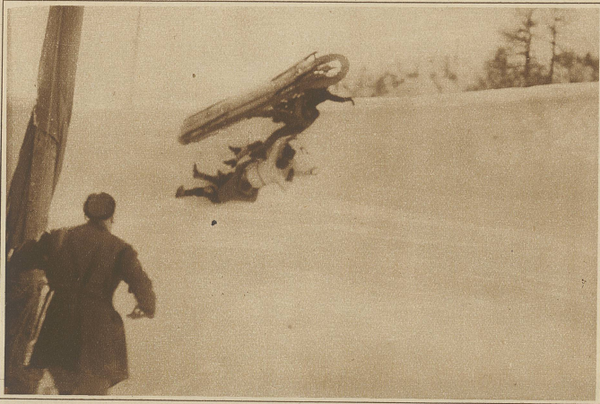
Ein gefährlicher Bobsturz anlässlich des großen Derby-Rennens vom 14. Februar in St. Moritz