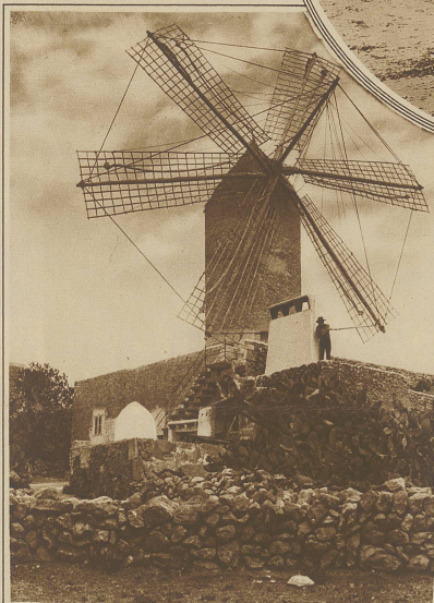
Typische Windmühle im Flachland der Insel. Die Mühle wird mit Segeln getrieben, die auf dem Bilde aufgerollt sind. Das Dach mit dem Räderwerk ist nach der Windrichtung verstellbar

die kleinere Insel Menorca und einige benachbarte Inselchen zählt) den Namen gegeben haben. Man leitet die Bezeichnung «Balearen» von dem griechischen Worte für «schleudern» ab. Im Verlaufe der punischen Kriege wurde Mallorca 123 v. Chr. von den Römern unter dem Konsul Q. Cæcilius Metellus erobert; er erhielt dafür den Beinamen «Balearicus», und wie vorher für die Karthager, so wurden die Inselbewohner jetzt als Schleuderer im römischen Heere verwendet. 3000 römische Ansiedler wur-