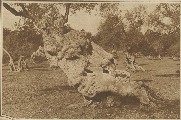
In einer Oelbaumpflanzung im Bergland der Insel mit grotesk geformten Stämmen, deren Alter auf 1000 und mehr Jahre geschätzt wird

liches Gebirge, das sich in seinen höchsten Punkten bis zu 1500 m erhebt und nur noch dem Oelbaum ein Fortkommen gestattet, reich an Abwechslung und an malerischen Ausblicken, — dort (und dies ist weitaus der größere Teil) eine endlos scheinende Ebene, über die zwar die Natur ihr ganzes Füllhorn ausgegossen hat, die aber aller landschaftlichen Reize barm ist, sofern nicht kunstgerecht angelegte Pflanzungen von Orangen, Zitronen, Feigen, Mandeln und anderen Südfrüchten als reizvoll