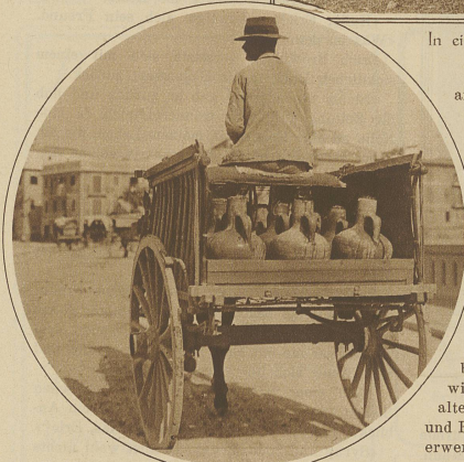
Ein Wasserverkäufer auf der täglichen Rundfahrt zu seinen Kunden

Landhaus, das er sich inmitten seines Besitzes errichtet hatte, gab er den Namen Miramar , und hier verbrachte er sein Leben lang inmitten seiner Bücher und seiner Sammlungen, wenn er nicht irgendwo im Innern nach Steinen grub oder nach alten Volkssagen forschte. Ob Mallorca jemals ein Reiseziel größeren Stiles und damit — wie es so schön heißt — «dem Fremdenverkehr erschlossen» werden wird, muß, solange das Dampfboot nicht gänzlich vom Flugzeug verdrängt wird, bezweifelt werden. Wer die Insel in ihren stillen Schönheiten und die Bevölkerung in ihrer kindlichen Anspruchslosigkeit kennen gelernt hat, möchte fast wünschen, daß dem paradiesischen Eiland diese Fortentwicklung erspart bliebe.