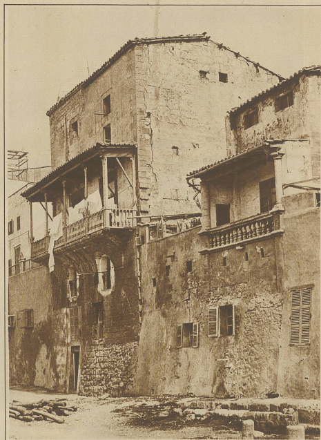
Blick auf die alte, gegen das Meer zu gelegene Stadtmauer von Palma. In die Mauer wurden, wie im Bilde ersichtlich, Wohnungen eingebaut