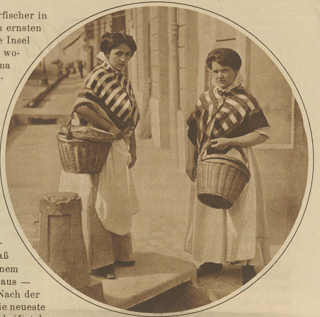
Landestübliche Tracht der Einwohnerinnen von Palma: großgemustertes Schal mit dem «Reboillo», einem unter dem Kinn geschlossenen, meist auf den Nacken herabfallenden Keppftuch aus weissem Tüll

Lust hat — das Leben der Mittelmeerfischer in all seinen Erscheinungsformen — den ersten und den heiteren — studieren. / Die Insel zählt heute rund 333000 Einwohner, wovon etwa 70000 auf die Hauptstadt Palma entfallen. Ihre Sprache ist das «Mallorquinische», eine dem Katalonischen verwandte Mundart, aber reichlich mit arabischen Bestandteilen durchsetzt. Die Insel umfaßt 3648 qkm, ist also etwas mehr als doppelt so groß wie der Kanton Zürich. Trotz der Entwicklung des modernen Verkehrs ist die Insel kein Touristenziel im weiteren Sinne geworden, wie sie ob ihrer Eigenart sicher verdiente. Abseits der üblichen Seeverkehrswege gelegen, ist Mallorca für den Durchschnittsreisenden un bequem zu erreichen, und so kommt es, daß in der Hauptsache Franzosen — dank einem direkten Schiffverkehr von Marseille aus — zu den Besuchern der Insel zählen. Nach der Sand haben sich in Frankreich, bis in die neueste Zeit hinein, eine ganze Reihe von Schriftstellern in mehr oder weniger guten Schilderungen mit Mallorca befaßt. Ihren eigentlichen Entdecker aber haben die balearischen Inseln — und insbesondere Mallorca — in dem (während des Weltkrieges gestorbenen) Erzherzog Ludwig Salvator von Oesterreich