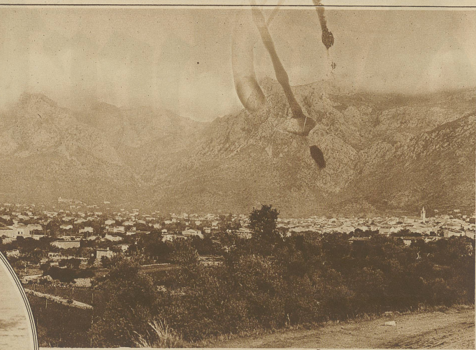
Blick auf das langgestreckte Städtchen Soller an der Nordwestküste der Insel, berühmt ob seiner Orangenausfuhr. Die Orangen von Soller gelten, obwohl sie sehr klein sind, als die besten der Welt. Unmittelbar hinter dem Städtchen erhebt sich der Buig Mayor (1445 m) der höchste Gipfel der Insel

Aber ein Hauch der modernen Zeit ist trotzdem auch nach Mallorca gedrungen. Schon die Sand hatte unrecht, als sie schrieb, daß auf der Insel «jegliche Industrie mangle»; denn die Töpferei wurde auf Mallorca seit alters gepflegt und ihre Erzeugnisse genossen solchen Ruf, daß das Wort «Majolika» — eine Verballhornung des Wortes Mallorca — geradezu zur Bezeichnung der Gattung der kunstvoll überglasierten Töpfereien wurde. Heute aber qualmen in Palma, der Hauptstadt, und in einigen anderen Orten der Insel die Fabrikschornsteine wie anderswo, wenn auch in beschränkter