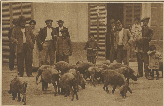
Typisches Bild aus dem Flachland: Ein Ferkelhändler zieht mit seiner Herde von Ort zu Ort. Die Schweinezucht steht auf Mallorca seit alters in hoher Blüte und bildet einen Haupterwerbszweig der Bevölkerung