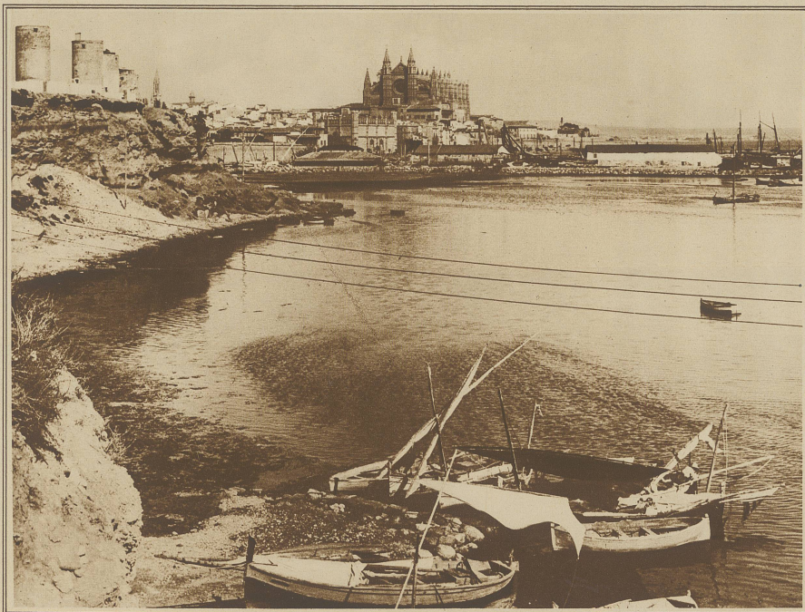
Blick auf den Hafen von Palma. Im Hintergrund die große, gotische Kathedrale, deren Bau 1230 begonnen, aber erst zu Anfang des 17. Jahrhunderts vollendet wurde. Links oben alte Windmühlen, die jetzt als Wohnstätten dienen

sen hat, mußte fremde Ansiedler herbeilocken. Welchen Schlag es die Ureinwohner waren, ist nicht geklärt. Sie waren im Altertum berühmt ob ihrer Treffsicherheit mit der Schleuder; sie wurden von den Karthagern zum Kriegsdienst gezwungen und waren als Sondertruppe hoch geschätzt. Diese seltsame Leidenschaft für die Schleuder, von der die Ureinwohner beseelt waren, soll der ganzen Inselgruppe (zu der man außer Mallorca noch