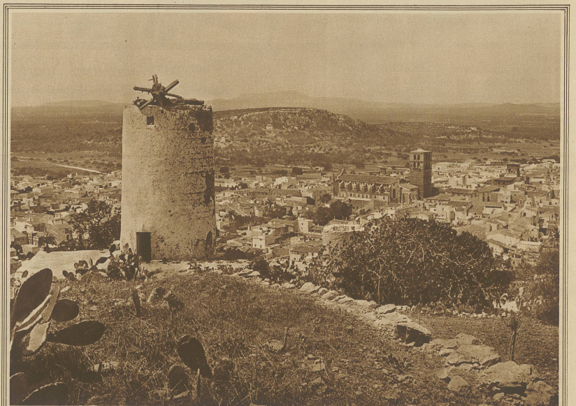
Blick auf das Städtchen Felanitx im Flachland der Insel, nahe der Ostküste gelegen und berühmt ob seiner kunstvollen Töpfererei, die schon im Altertum großen Ruf genossen. Im Vordergrund eine verfallene Windmühle