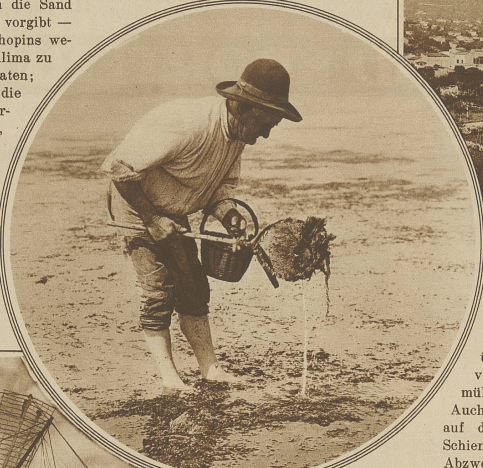
Krabbenfischer bei der Arbeit am Meeresufer, unweit der Hauptstadt Palma

Daß sie sich mit den Einheimischen nicht verstand, lag an ihr selbst; ihre zur Schaugetragene Religionslosigkeit mußte bei einer so strenggläubigen Bevölkerung Anstoß erregen, und die Bosheiten, mit denen sie in ihrem Buch die Eingeborenen bedankt, sind nicht ganz gerechtfertigt. Immerhin — wegen der