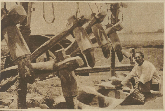
Eine der uralten Reismöhlen, wie sie in gleicher Form seit Jahrtausenden betrieben werden