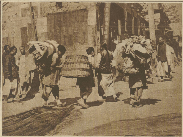
Lumpensammlerinnen auf ihrem Gang durch die Straßen