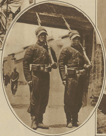
Chinesische Wachtposten vor einem Munitionsdepot