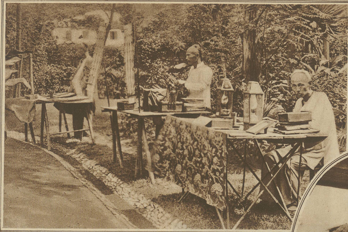
Ein eigenartiger Straßenberuf. «Zukunftsprorspheten» üben ihren Beruf längs der Straße aus