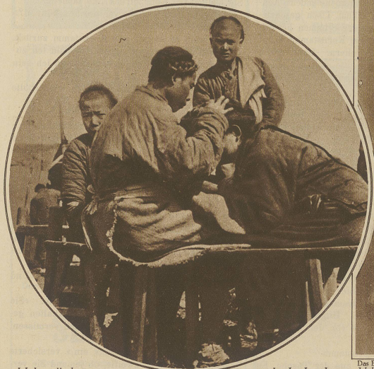
Ueberall das gleiche Leiden: Eine vielgeübte Beschäftigung der Bevölkerung am Jang-tse-kiang