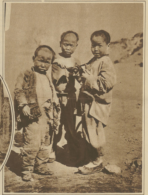
Aus einem Dorfe am Jang-tse-kiang, Ein jugendliches Kleeblatt beim Zopf flechten