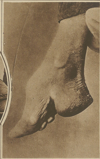
Das Ende einer alten Tradition. Die Fußverkrüppelung, die in China seit Jahrhunderten zum guten Ton gehörte, ist nun durch Erlass des Gouverneurs der hauptsächlichsten Bezirke verboten und unter strenge Strafe gestellt worden. Unser Bild zeigt die typische Form eines verkrüppelten Fräuleinfußes