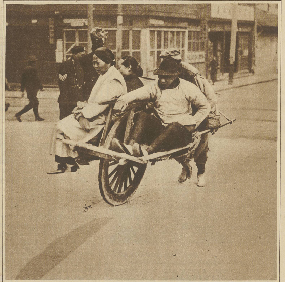
Das in China übliche Verkehrsmittel: Der Einradkarren