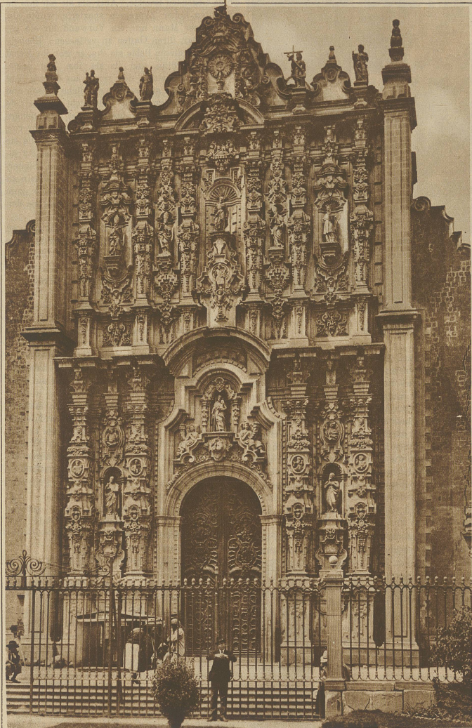
Der Eingang zum Sagrario, das an die Kathedrale der Hauptstadt angebaut ist

lich nur zwei Züge auf dieser Strecke verkehren. Viel näher lag die Vermutung, daß mexikanische Banditen die Brücke in Brand gesteckt hatten, um von dem dadurch entstehenden Eisenbahnunglück zu profitieren. Daß wir ausnahmsweise einmal zu früh waren, hat uns gerettet. Nachdem in einer Arbeit von einem halben Tage die angebrannten Pfeiler durch herbeigeschafften Ersatz wieder hergestellt waren, konnten wir die Fahrt dem Norden entgegen wieder fortsetzen. Ich muß gestehen, daß ich erleichtert aufatmete, als wir in dem kleinen mexikanisch-amerikanischen Grenzstädtchen Nogales anlangten, wo die Kultur, allerdings damit auch Zoll- und Paßplackereien der Amerikaner, die wegen dem Einwanderungsverbot besonders schwierig waren, angingen. Eine Flasche Canadian Club, die ich im Mantel verborgen hatte, erleichterte mir den Uebergang in das