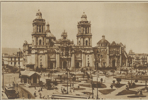
Gesamtansicht der Kathedrale von Mexiko-City, die als eine der schönsten des amerikanischen Kontinentes gilt. Rechts das Sagrario

Ganz Mexiko hat eine Bevölkerung von rund 15 000 000 Menschen, von denen mehr als die Hälfte weder lesen noch schreiben können. 38% der Bevölkerung bestehen aus reinen Indianern, 43% aus Mischlingen, 19% von weißer oder fast weißer Abstammung. Seit der Eroberung von Mexiko im Jahre 1522 ist das Land der Schmelztiegel der Nationen geworden; wenige