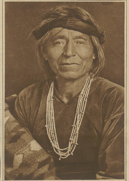
Der Typus eines mexikanischen Indianers mit seinem bunten Poncho

In Mexiko gedeihen über 500 verschiedene Kaktusarten