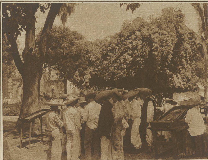
Feilschende Händler mit ihren großen Strohhüten, auf dem Dorfplatz

mexikanisches Sprichwort sagt: «Tres meses de agua, tres meses de polvo, tres meses de lodo y tres meses de todo» (drei Monate Wasser, drei Monate Staub, drei Monate Schmutz und drei Monate von allem ein wenig), was an und für sich für das Land ja keine große Reklame macht und zu Mexiko-Reisen nicht gerade ermuntert. Es sei zwar bemerkt, daß ja auch unsere schönen Zürcher Reisebücher den Nebel und Regen dem Reisenden meist unterschlagen.