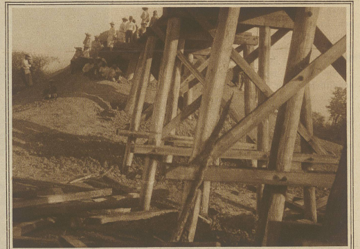
Die wieder hergestellte Eisenbahnbrücke aus Holz, die von Banditen angezündet wurde und beim Herannahen unseres Zuges in hellen Flammen stand

Hauptsache von Indianern bewohnt ist, wurde sie gefeiert. Interessiert hat uns, daß als Königin des Festes nicht etwa eine Indianerin, sondern eine Weiße ausersahen wurde. / Die Fahrt von Tepic nach der nord-amerikanischen Grenze brachte uns manches Schöne und Interessante. Nicht so rasch vergessen werden wir den Zwischenfall, der sich auf einsamer Strecke zwischen zwei mexikanischen Stationen ereignete. Unser Zug wurde plötzlich ruckartig gebremst, alles sprang aus dem Wagen; wir sahen, wie eine kleinere Holzbrücke, über die der Zug hätte fahren sollen, vor uns in Brand war. Welcher Ursache das Feuer zuzuschreiben war, weiß man heute noch nicht; Funkenwurf einer Lokomotive kann man das Ereignis wohl kaum zuschreiben, da wöchent-