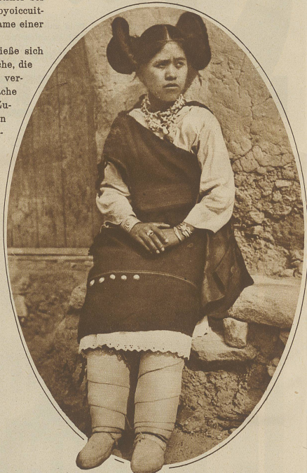
Eingeborenes Indianermädchen mit dem Haarschmuck der Unverheirateten

Costumbre del país! Diese Landesitten, diese Höflichkeit helfen, wenn man sie einmal auf ihr richtiges Niveau einschätzen gelernt hat, doch über manches Unangenehme und manche Schwierigkeit hinweg.