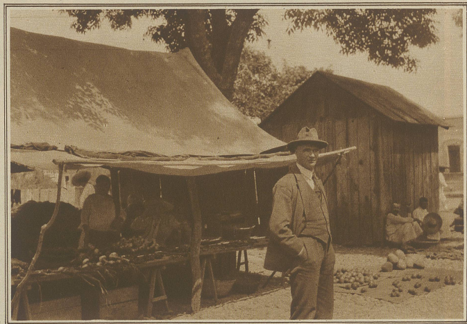
Der Verfasser unseres Artikels vor den Marktständen eines kleinen Dörfchens im Landesinnern

Manches wäre noch zu erzählen über die Vergnügen der Mexikaner. Stier- und Hahnenkämpfe spielen auch in Mexiko eine große Rolle,