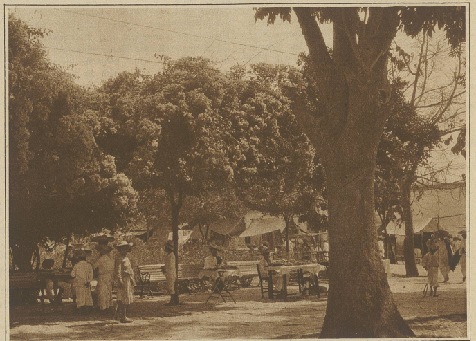
Blick auf die «Plaza» in einem mexikanischen Dorfe

«trockene» Amerika. / Die schöne und interessante Fahrt vom atlantischen zum pazifischen Ozean, der Länge nach durch Mexiko und über die Cordilleren, wird mir stets in guter Erinnerung bleiben.