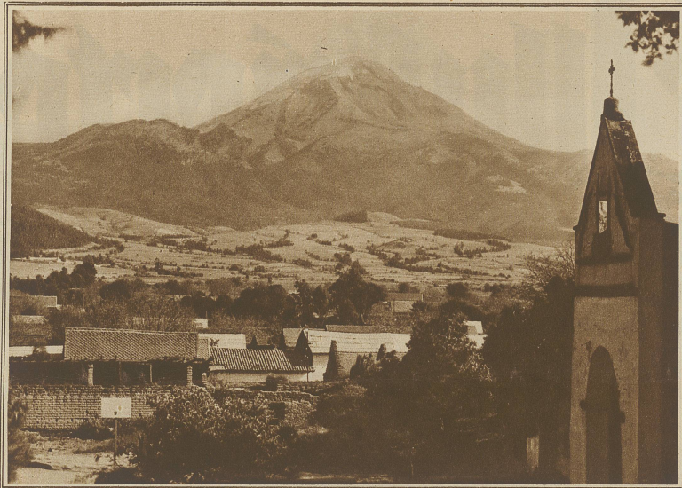
Mexikanische Landschaft, im Hintergrund der Vulkan Popocatepetl (der rauchende Berg)