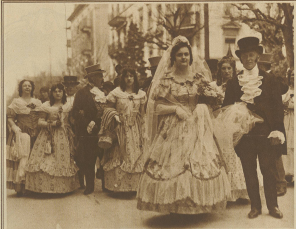
Die arme Baronin