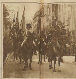
Die Banner der Zünfte