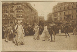
Leute von Schwyz (Dietsgen)