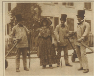
Die drei gerechten Kammacher