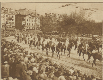
Die Heiden des Monats