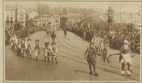
Die arme Baronin