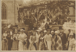
Die Doppelhohler aus «Martin Salander»