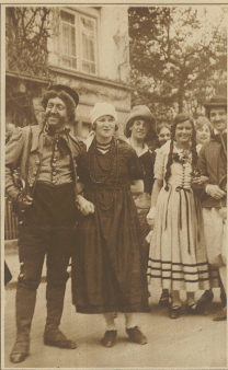
Die Leute von Schwyz