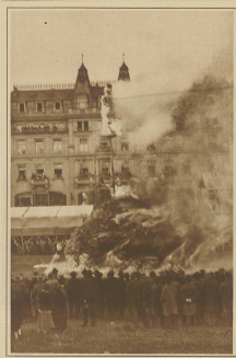
Der brennende Berg