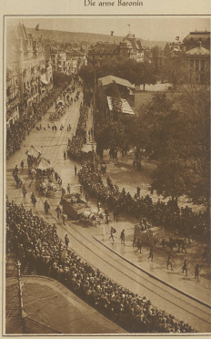
Aus dem Umeuz mit Blick auf die Theaterstrasse