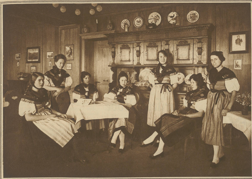
Das Baselbieterstübl in der Schweizer Mustermesse