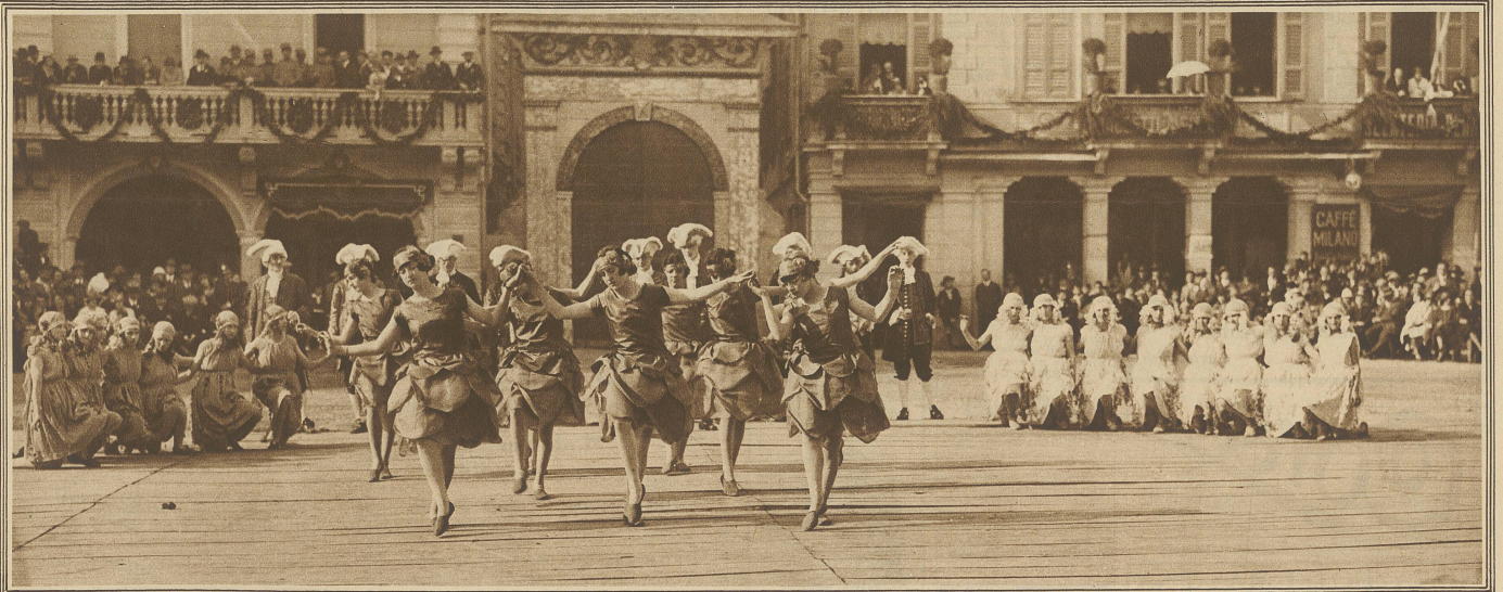
Tanz der Kamelien mit der Kamelienkönigin in der Mitte