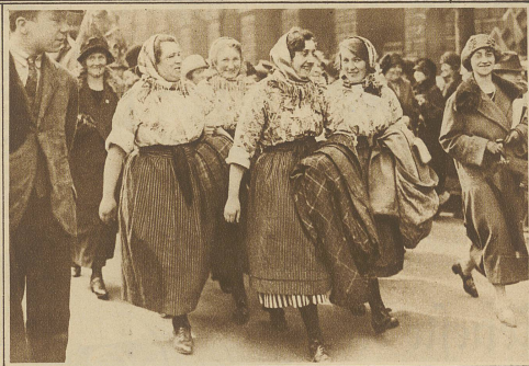
Große Frauendemonstration in London