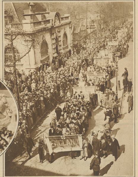
25,000 Frauen aller Gesellschaftsklassen aus den verschiedensten Gegenden Englands veranstalteten letzte Woche in London eine große Antireiكدemonstration Der Demonstrationzug unterwegs zur Albert Hall