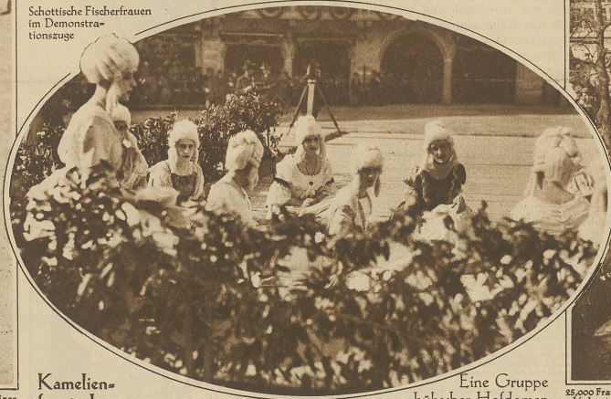
Kameliensfest in Locarno